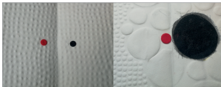
Figure 2. Retranscription du discours des enfants concernant le Loup après agrandissement.