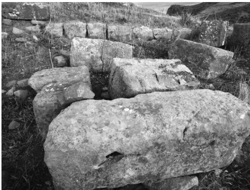
Hışn Caldis (Genio Municipi Caldesium)