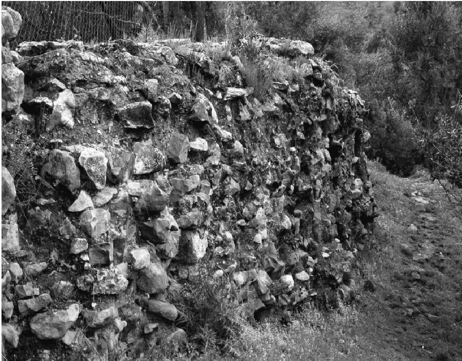
Vestiges de la citadelle d'Ikḡān