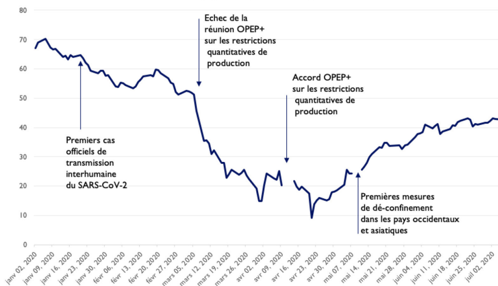
Graphique I. Prix Spot du baril de Brent ($, jan-juil 2020)