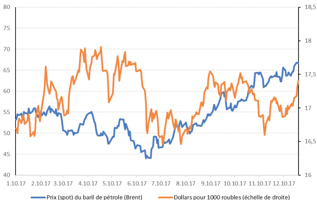
Graphique 2. Prix du pétrole et taux de change du rouble en 2017