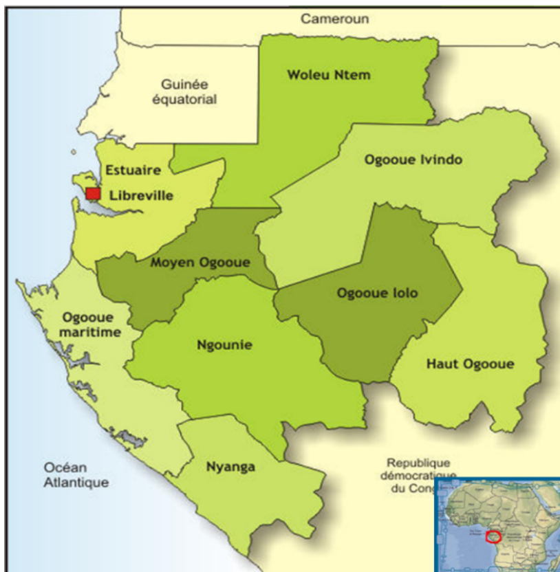
Carte 1 : Le Gabon