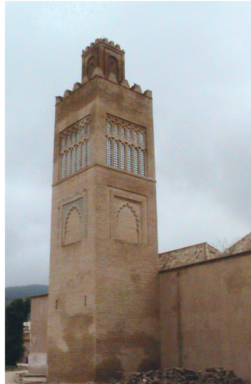
Fig. 4. Minaret de la mosquée du Méchouar.

De tels détails sont absents du récit qu’al-Tanasī consacre au second grand siège mérinide. Il révèle simplement d’une part que le sultan Abū al-Ḥasan se présenta devant Tlemcen et fonda une ville pour maintenir le siège, d’autre part qu’il parvint à pénétrer dans la ville le 28 ramaḍān 737/30 avril 1337, et qu’il tua le monarque zianide Abū Tāšfin, ses fils et son vizir 53 .