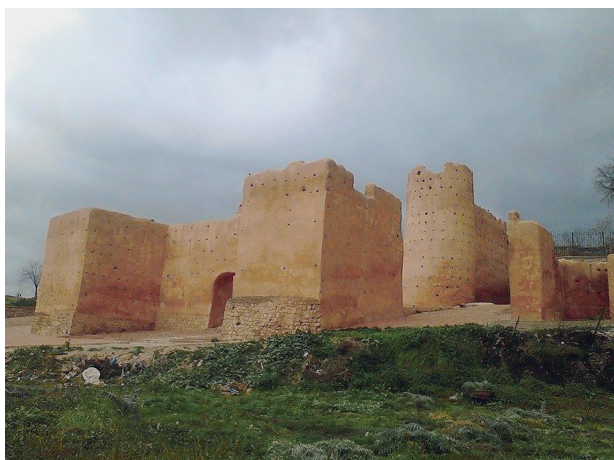
Fig. 5. Bāb al-Qarmādīn.

avec précision le plan général du système de défense de Tlemcen et d'attribuer à chacun de ses maîtres successifs tels ou tels travaux 56 . D'ailleurs, il faut prendre en compte le fait que les Mérinides eux-mêmes édifièrent une ceinture de murailles pour l'enfermer.