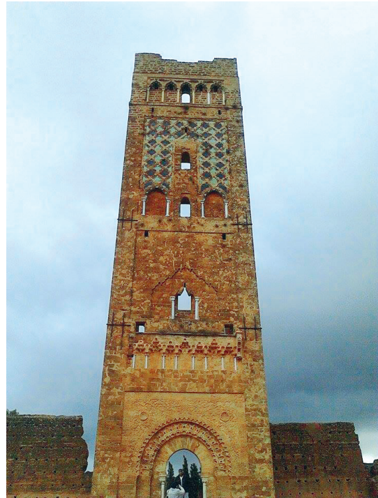
Fig. 3. Minaret de la grande mosquée de Mansoura.

On le voit, les historiens qui ont étudié les sièges de Tlemcen au XIV e siècle se sont très largement appuyés sur des sources narratives. Il est vrai que la documentation archivistique et épigraphique est de peu de secours pour l'historien 26 . Cependant, il est à noter qu'un document épigraphique de la Mosquée al-'Ubbād et de sa medersa témoigne de la prise de la ville par le sultan mérinide Abū al-Ḥasan. Aussi, l'inscription commémorative de la grande mosquée de Mansoura (fig. 3) est un autre témoignage épigraphique sur la présence et