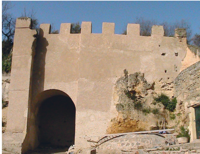
Fig. 6. Bāb al-ʿAqaba, découverte lors des travaux de restauration de 2011.

Il semble bien que les blocus de Tlemcen n'empêchèrent pas complètement les habitants d'en sortir. Plusieurs textes médiévaux montrent que certains d'entre eux purent en fuir – ainsi Abū al-ʿAbbās Aḥmad b. Marzūq (m. 741/1340), qui la quitta pendant le premier grand siège. En outre, le serviteur de son père y introduisait régulièrement des vivres avec la complicité des soldats mérinides 66 . Enfin, ʿAbd al-Raḥmān b. Ḥaldūn rapporte dans son récit autobiographique, al-Taʿrīf , que son maître Abū ʿAbd Allāh b. Ibrāhīm al-Ābilī franchit la muraille de la cité au moment du blocus mis en place par le sultan Abū Yaʿqūb Yūsuf 67 .