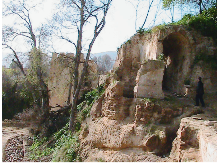
Fig. 2. Fortification d'Agadir.

Les attaques et les sièges menés contre Tlemcen ont fait l'objet, à l'époque coloniale, de nombreuses notices d'une valeur inégale. Dès la prise finale de la ville par les armées françaises, un intérêt a été porté à l'histoire militaire de la ville au Moyen Âge en raison de la présence remarquable des vestiges de remparts dans les trois sites de Tlemcen 11 . En 1847, Agénor Azéma de Montgravier, militaire et archéologue français, écrivit un ouvrage sur ses Excursions archéologiques d'Oran à Tlemcen ,