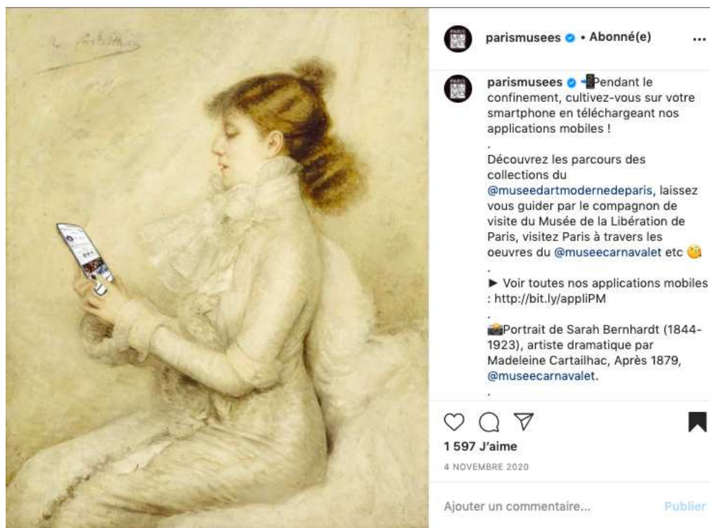
Fig. 7. Photographie, capture d'écran réalisée depuis l'interface d'Instagram, avec l'aimable autorisation d'Hélène Boubée, chargée de communication digitale de Paris Musées. Madeleine Cartailhac, Portrait de Sarah Bernhardt, , après 1879. Peinture à l'huile, 41 x 33 cm, Paris, Musée Carnavalet.