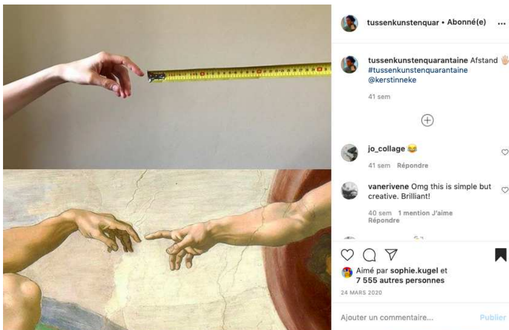
Fig. 6. Photographie, capture d'écran réalisée depuis l'interface d'Instagram, Michel-Ange, détail de La Création d'Adam, 1508-1512. Fresque, 285 x 570 cm, Vatican, chapelle Sixtine.