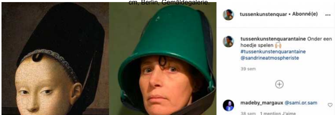
Fig. 8. Photographie, capture d'écran réalisée depuis l'interface d'Instagram, avec l'aimable autorisation de l'utilisatrice @sandrineatmospheriste. Petrus Christus, Portrait d'une jeune fille, 1470. Huile sur bois, 29 x 22,5 cm, Berlin, Gemäldegalerie.