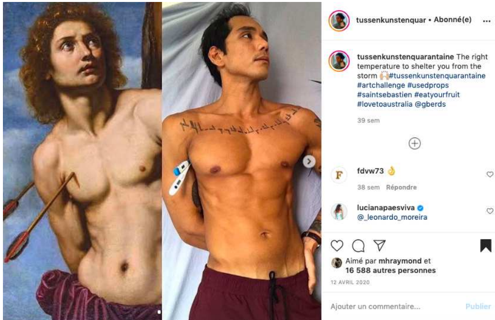
Fig. 5. Photographie, capture d'écran réalisée depuis l'interface d'Instagram. Ottavio Vannini, Saint Sebastien, XVIIe siècle. Huile sur toile, 89 x 69 cm, coll. privée.

participations au défi – l'adjonction d'un objet anachronique vis-à-vis de la temporalité de la représentation que l'œuvre originale donne à voir a pour but de référencer l'image au regard du confinement. Cet exemple et ses similitudes avec le défi révèlent que les musées n'hésitent pas à s'inspirer des esthétiques ambiantes et populaires au sein des plates-formes sur lesquelles ils communiquent. Cette donnée invite à interroger leurs stratégies communicationnelles.