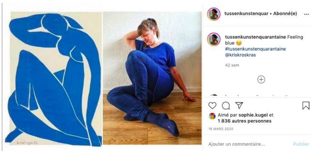
Fig. 1. Photographie, capture d'écran réalisée depuis l'interface d'Instagram. Henri Matisse, Nu bleu II , 1952. Papiers gouachés, découpés et collés sur papier marouflé sur toile, 103,8 x 86 cm, Paris, Centre Pompidou.

Avant même le confinement et l'invention de ce défi, il existait déjà, au sein de la plate-forme Instagram, une mode remarquablement populaire consistant à se prendre en photographie face aux œuvres, de manière à s'en faire l'écho, généralement via la couleur de ses vêtements ou sa gestuelle. Ces « photographies échos », également appelées matchings (« correspondances »), étaient réalisées in situ dans les espaces d'exposition. Certaines de ces photographies sont tout à fait comparables à celles réalisées dans le cadre du défi. C'est par exemple le cas de ces deux photographies (fig. 1 et fig. 2) qui reprennent respectivement les Nu bleu II et IV d'Henri Matisse.