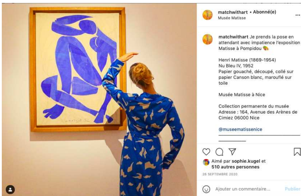
Fig. 2. Photographie, capture d'écran réalisée depuis l'interface d'Instagram, avec l'aimable autorisation de l'utilisatrice @matchwithart. Henri Matisse, Nu bleu IV, 1952. Papiers gouachés, découpés et collés sur papier Canson blanc marouflé sur toile, 103 x 74 cm, Nice, Musée Matisse.

Divers dispositifs technologiques sont utilisés, depuis le début des années 2000, par les institutions muséales à des fins de médiation culturelle. En effet, on voit à cette époque apparaître une médiation technologique des œuvres dont la vocation est d'accompagner in situ les expositions : un moyen pour les publics d'appréhender les œuvres – et plus largement les propositions culturelles – notamment grâce à des « tables multitactiles » et à d'autres dispositifs comparables. Comme le remarque Jean-Claude Chirollet (2014, p. 18-19) :