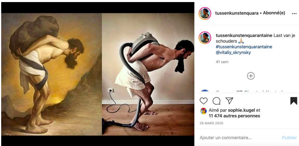
Fig. 3. Photographie, capture d'écran réalisée depuis l'interface d'Instagram. John Roy Newton, Sisyphus, 2012. Huile sur toile.

participants intègrent des objets représentatifs de leurs tâches quotidiennes, de manière à rejouer des œuvres qui, originellement, n'incluaient pas cette dimension dans leurs représentations. Sur cette photographie (fig. 3), un aspirateur (représentant les tâches domestiques et, par extension, le foyer) a remplacé le rocher de Sisyphé. Via la modification du fardeau, le mythe se voit transposé (ou artificiellement hypostasié) de manière à faire écho au confinement : le quotidien rythmé de tâches ménagères et d'enfermement semble épuisant et sans fin, au même titre que la condamnation de Sisyphé. De surcroît, précisons que le fait que les internautes aient eu la possibilité de sélectionner des œuvres dénuées de représentation humaine et, donc, de décider de ne pas apparaître sur les photographies s'intègre également dans ce premier niveau d'expression. C'est par exemple le choix de cette participante concernant sa réalisation (fig. 4), pour laquelle elle a choisi le Tournesol de Gustave Klimt qu'elle a recomposé avec des végétaux.