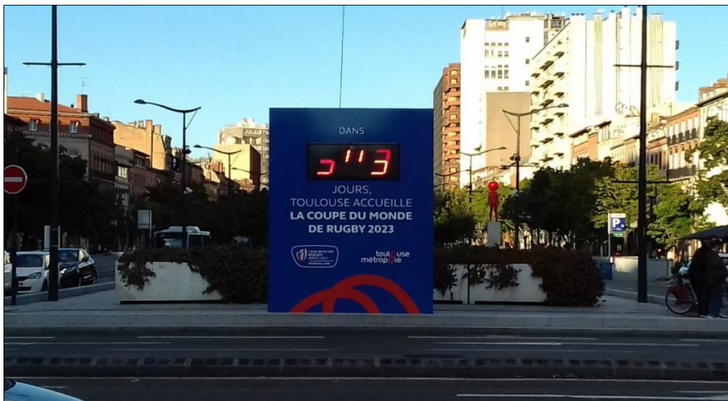
Illustration n° 6. Compte à rebours de la Coupe du monde de rugby Toulouse 2023, Patrice Ballester, 2022

Cette création d'agence a été une avancée majeure dans l'histoire et la géographie touristiques de Toulouse : durant la période du Covid-19, cette structure novatrice a montré toute sa capacité à fédérer et à enclencher de nouveaux programmes et de nouvelles ambitions.