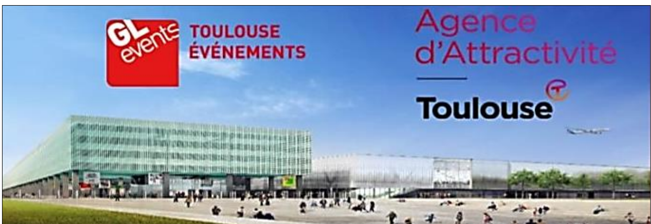
Illustration n° 4. Le MEETT, le nouveau parc des expositions et centre de conventions toulousain, MICE et agence d'attractivité toulousaine, Atout Toulouse, 2020.

Dernier point qui constitue une identité forte du territoire toulousain : les opérateurs publics doivent mieux travailler sur l'axe du tourisme d'affaires, notamment en utilisant la logique de cluster et de perméabilité avec les entreprises locales et le milieu universitaire. Le territoire français recèle de véritables atouts : d'importantes structures de congrès et structures de charme sont disponibles sur tout le territoire. Les vitrines métropolitaines se compléteront agréablement par l'offre des villes moyennes, pour peu que les synergies soient travaillées. Il existe un véritable enjeu consistant à opérer une approche concertée des métropoles pour attirer les grands congrès ou l'événementiel scientifique, puis répartir l'activité MICE. Car l'objectif n'est pas seulement de parvenir à louer des lieux sur le territoire, mais aussi d'organiser des événements totalement adaptés aux demandes, dans un but éventuel d'investissement sur celui-ci : par exemple, un salon de l'automobile et la présentation du territoire auprès de dirigeants commerciaux des marques peuvent drainer ensuite l'achat d'un tournage pour la sortie d'un véhicule (paysage de Carcassonne, canal du Midi, place du Capitole...) ou même le lancement pour l'Europe d'un véhicule avec tous les commerciaux de la marque.