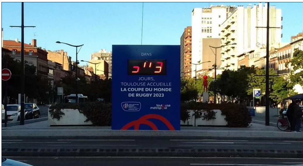
Illustration n° 6. Compte à rebours de la Coupe du monde de rugby Toulouse 2023, Patrice Ballester, 2022

Cette création d'agence a été une avancée majeure dans l'histoire et la géographie touristiques de Toulouse : durant la période du Covid-19, cette structure novatrice a montré toute sa capacité à fédérer et à enclencher de nouveaux programmes et de nouvelles ambitions.