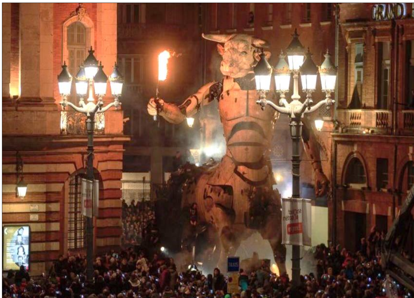
Illustration n° 4. Le Minotaure arrivant place du Capitole, La Machine, Mairie de Toulouse, 2018