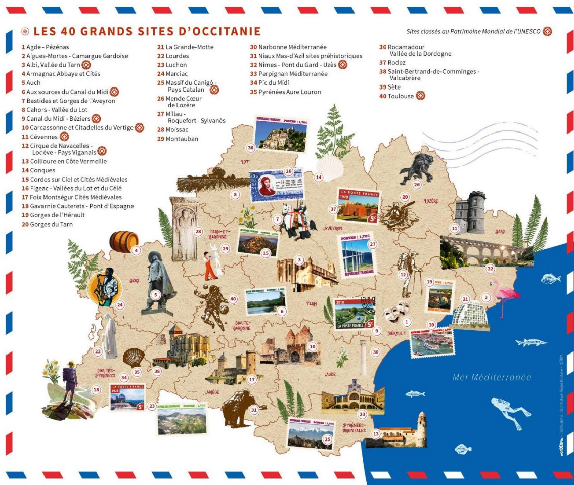
Illustration n° 1. Les 40 Grands Sites d'Occitanie, 2020