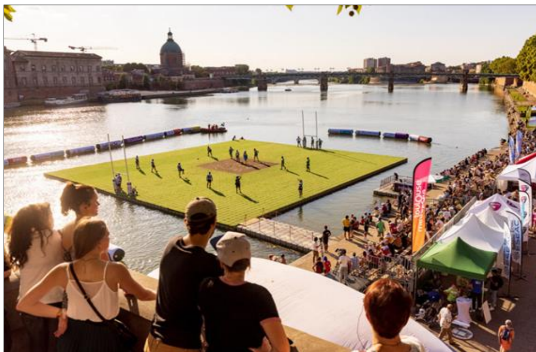
Illustration n° 5. Water rugby, Mairie de Toulouse, 2022

À ce titre, l'organisation de matchs et notamment la présence de la délégation et de l'équipe du Japon à Toulouse pour la Coupe du monde de rugby 2023 montrent toute la pertinence de la création de cette agence d'attractivité. Si les matchs se jouent au Stadium de Toulouse, facilement accessible depuis le centre-ville en transports en commun et navettes, la Coupe du monde se veut au plan touristique – affaires et loisirs – une Coupe du monde « à la découverte des territoires ». Des actions sont actuellement menées auprès du public japonais, des acteurs du rugby et de la structure hôtelière toulousaine et de ses environs. Dans ce cas précis, l'anticipation est importante, et le devenir de la manifestation et de ses rapports complémentaires entre les territoires s'entrevoit. En tant que porte d'entrée, Toulouse offre différentes formes de tourisme et des stratégies adéquates : prolonger le séjour, montrer le savoir-faire économique-culturel de la métropole et de son environnement proche, établir des liens avec des villes satellites comme Carcassonne et Albi par exemple.