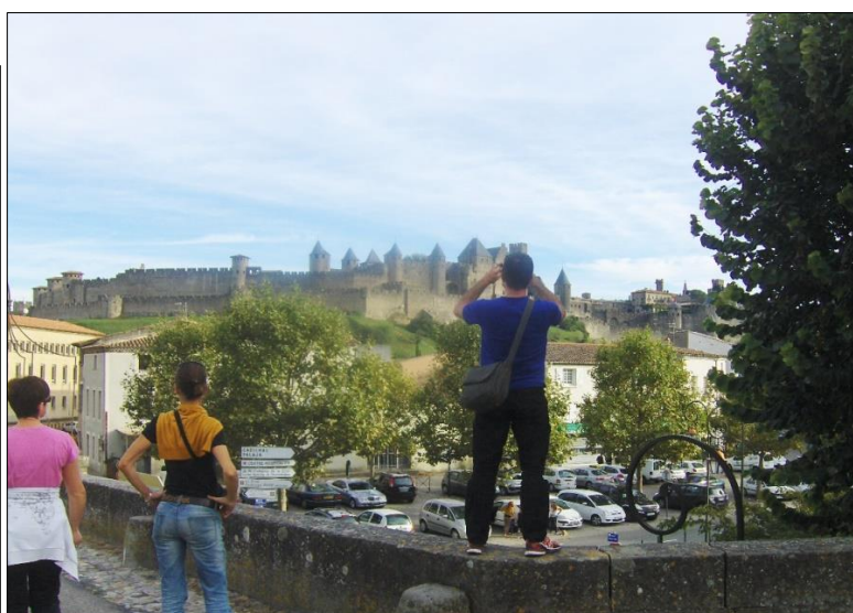
Illustrations n° 2. Toulouse, Albi, Carcassonne : le triangle d'or, Région Occitanie, 2022, et cité de Carcassonne, Patrice Ballester, 2014

« Le triangle d'or désigne l'espace situé entre Toulouse, Carcassonne et Albi où l'on cultivait jadis le pastel. [...] Partez sur ses traces à travers des paysages aux airs de Toscane. »