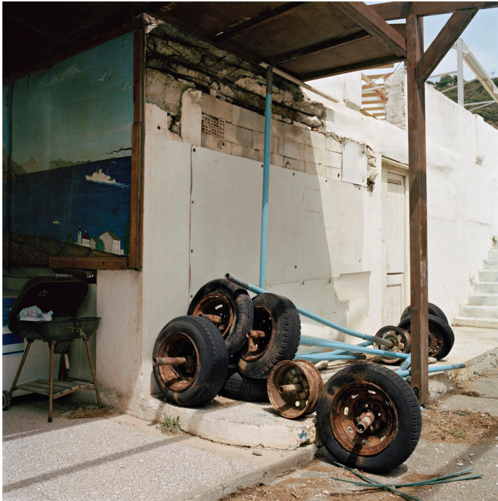
Therma, site thermal depuis l'antiquité, ayant accueilli les exilés communistes lors de la guerre civile (1946-1949), Ikaria, Grèce, 4 avril 2018.