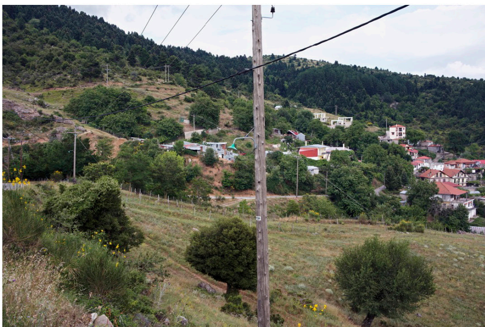
Au nord de Karpenisi, site des premiers essais par l'armée américaine du Napalm à la fin de la seconde guerre mondiale, et site d'un charnier de la guerre civile (1946-1949), Eurytanie, Grèce, août 2018.