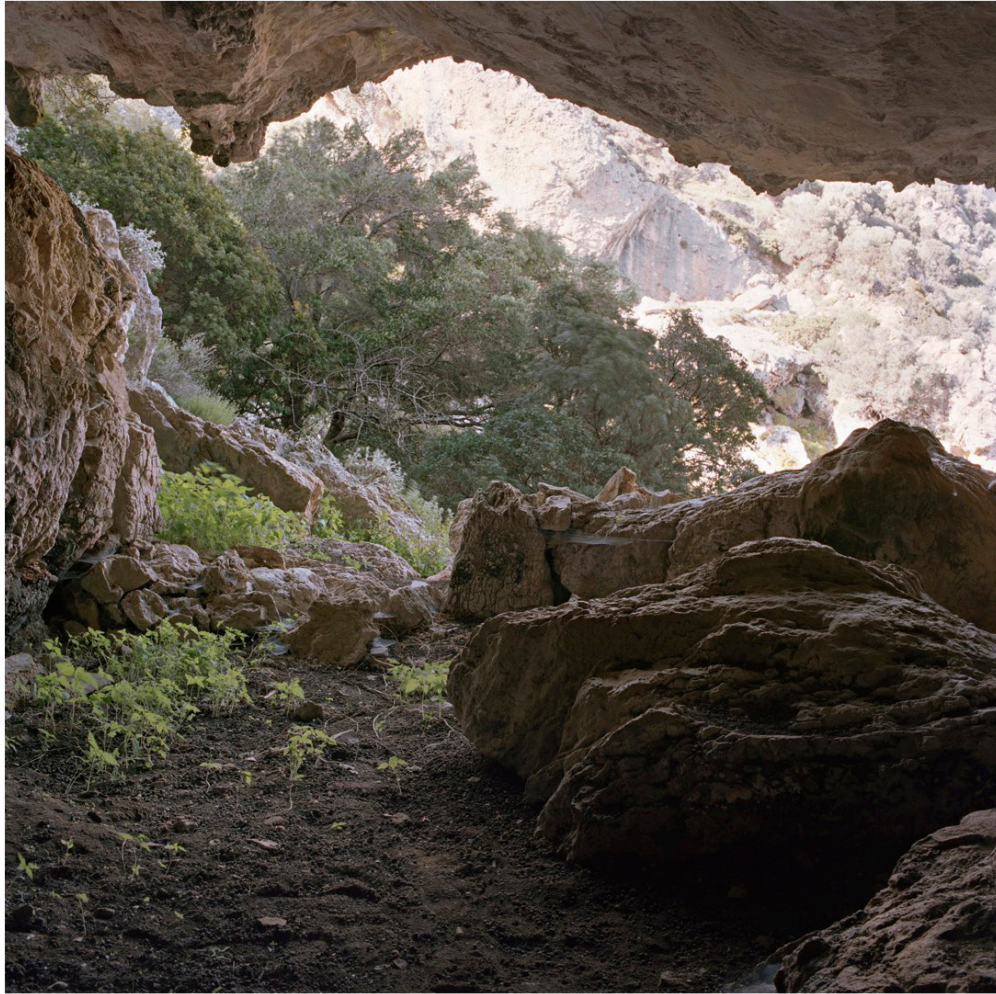
Grotte près de Therna ayant permis aux exilés communistes de se cacher avec l'aide de la population lors de la guerre civile (1946-1949), Ikaria, Grèce, avril 2018.