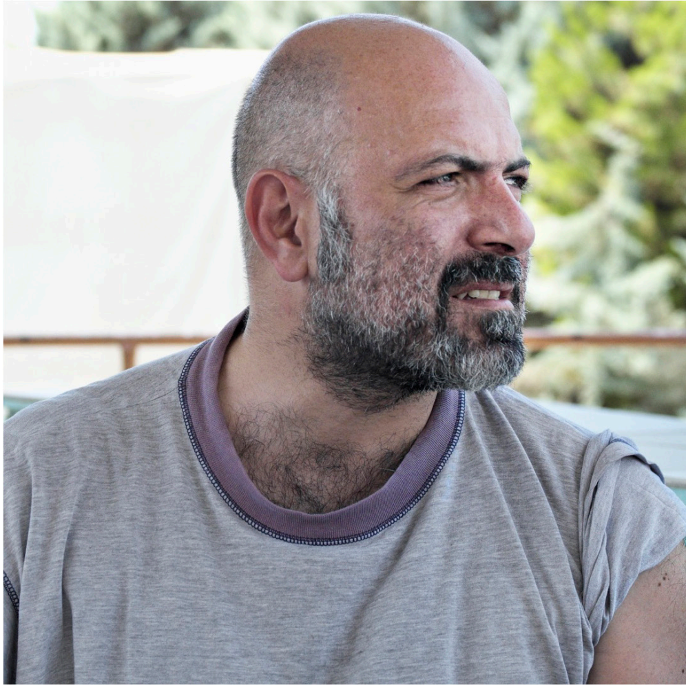
Ouvrier informaticien à l'usine autogérée en coopérative Viome, banlieue de Thessalonique, Grèce, 2017.