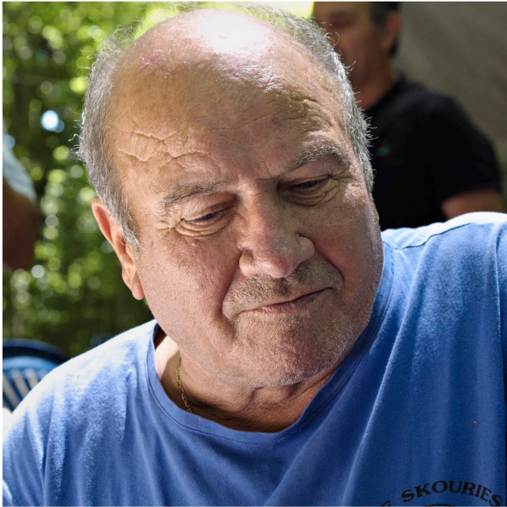
Mineur en retraite, militant contre l'ouverture de la mine d'or de Skouries, Calcidique, Grèce, juillet 2017.