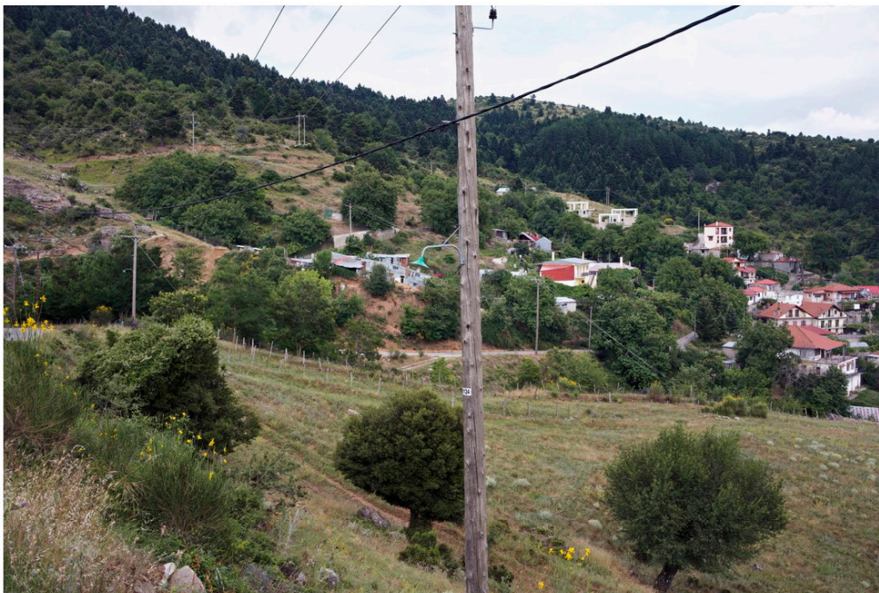
Au nord de Karpenisi, site des premiers essais par l'armée américaine du Napalm à la fin de la seconde guerre mondiale, et site d'un charnier de la guerre civile (1946-1949), Eurytanie, Grèce, août 2018.