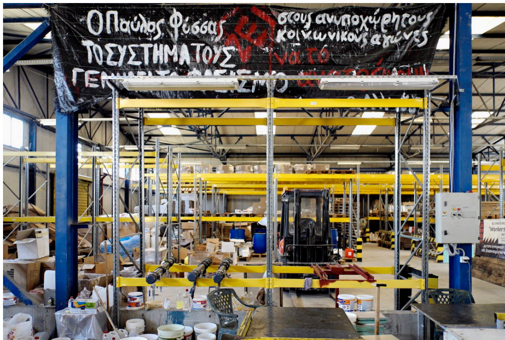
Usine autogérée Viome, banderoles de la rencontre internationale des usines en autogestion, en mémoire de Pavlos Fissas, rappeur assassiné par Aube Dorée, banlieue de Thessalonique, juillet 2017.