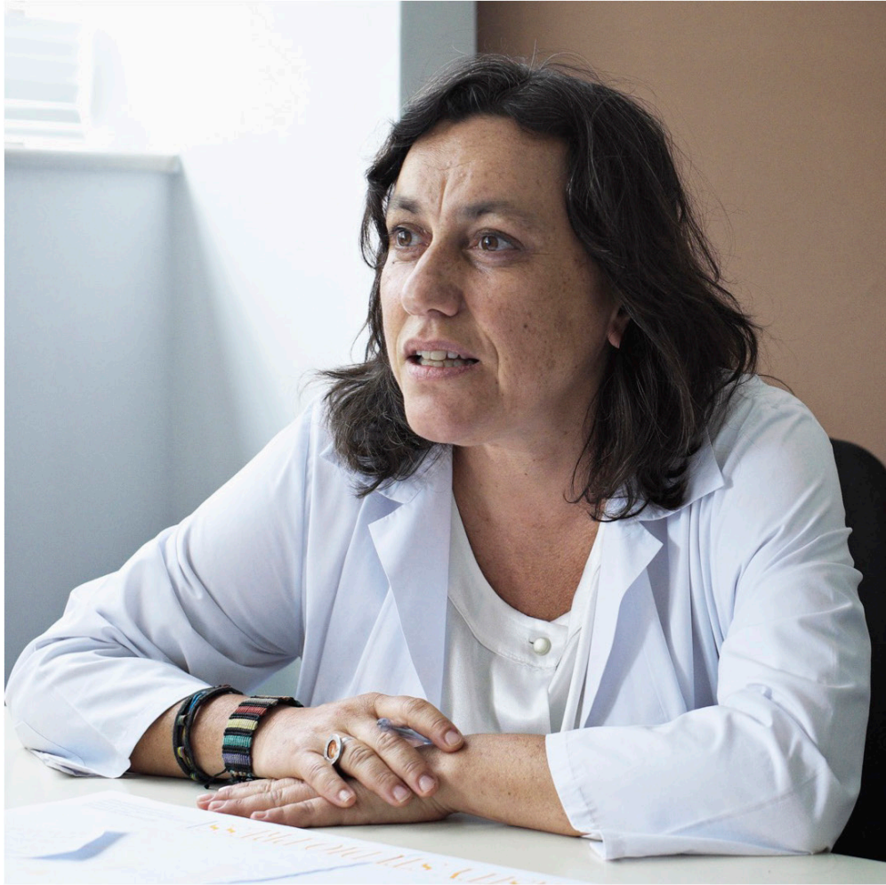
Médecin hospitalier à Thessalonique, co-fondatrice de la clinique solidaire autogérée gratuite de Thessalonique, Grèce, 2017.