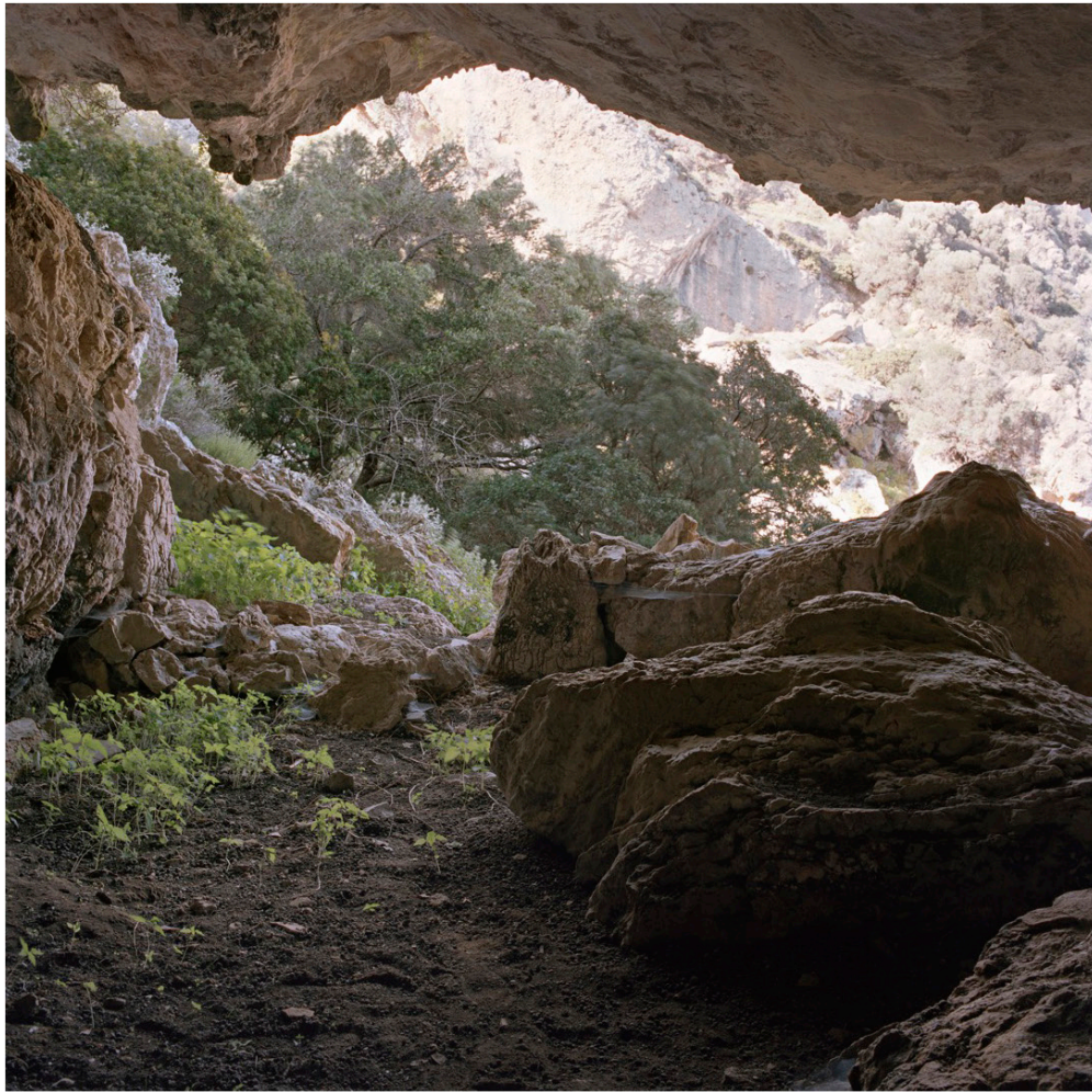
Grotte près de Therna ayant permis aux exilés communistes de se cacher avec l'aide de la population lors de la guerre civile (1946-1949), Ikaria, Grèce, avril 2018.