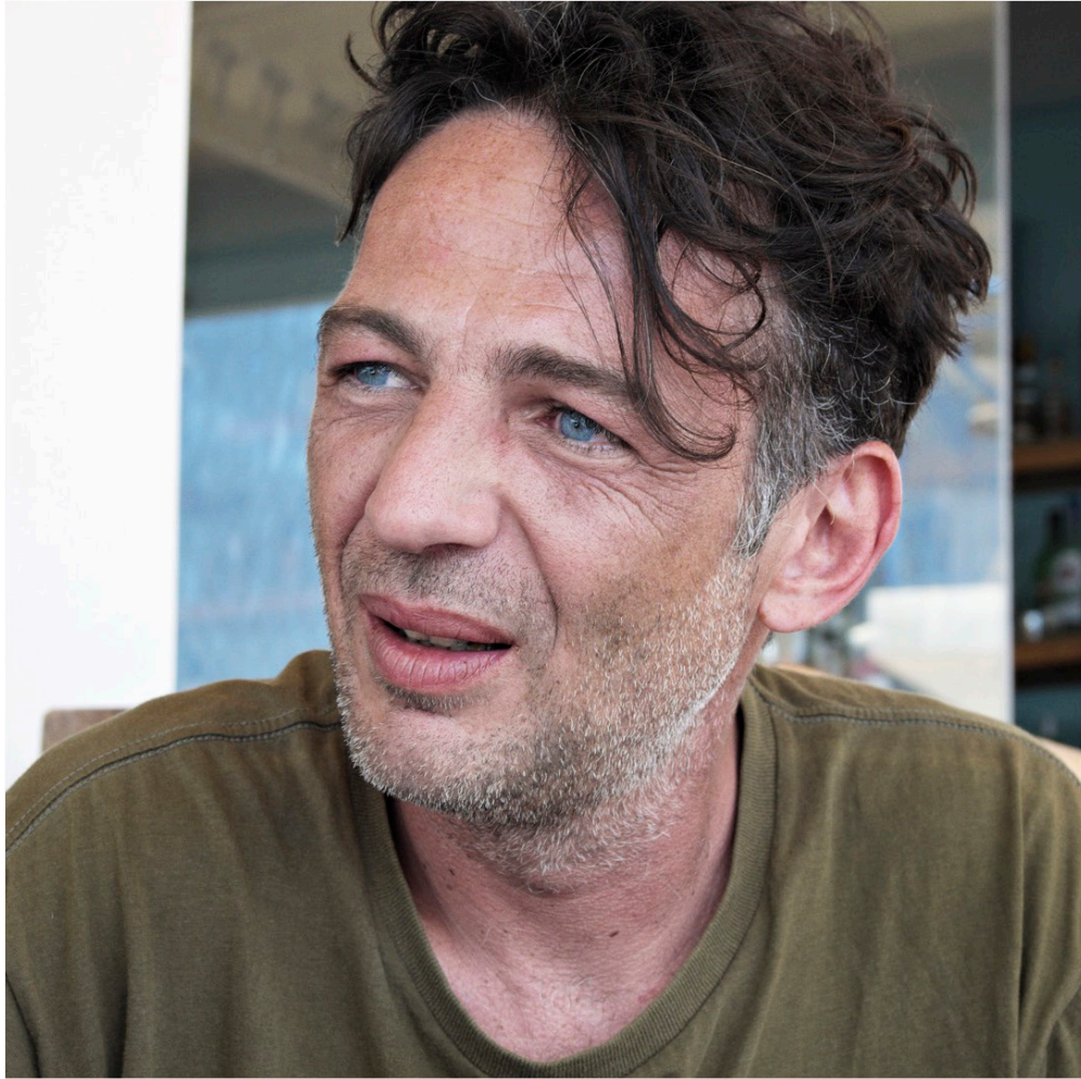
Médecin généraliste hospitalier, militant pour la sauvegarde de l'hôpital d'Agios Kirikos, île d'Ikaria, Grèce, 2018.