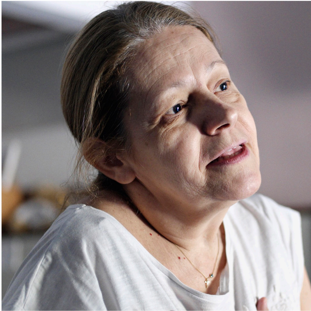
Professeure de biologie mise d'office en retraite, responsable de la pharmacie à la clinique solidaire autogérée de Elliniko, Athènes, Grèce, 2017.