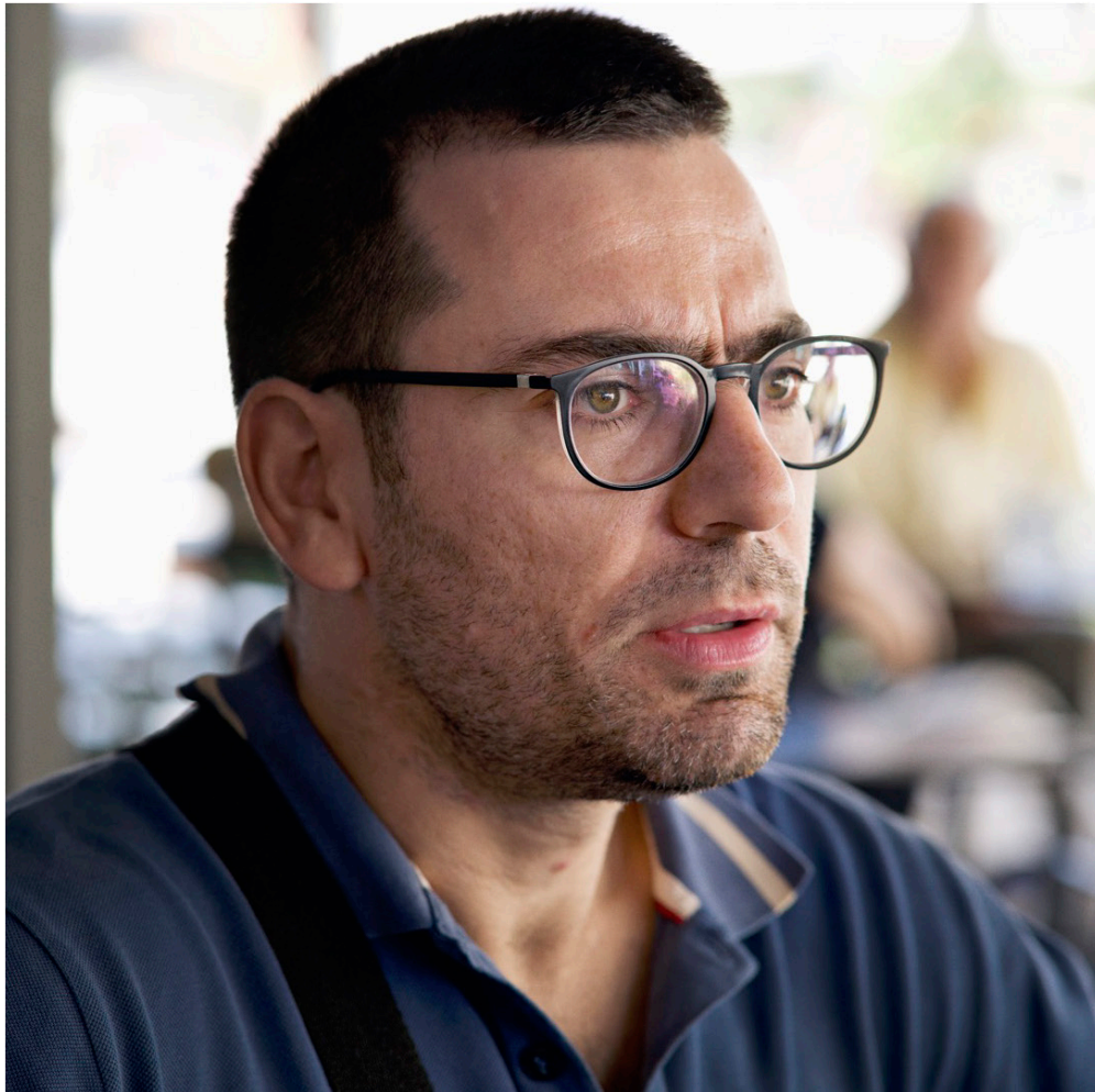
Médecin généraliste, membre du mouvement Kinisi d'accompagnement et de défense des droits des jeunes réfugiés et migrants, Patras, Grèce, 2018.