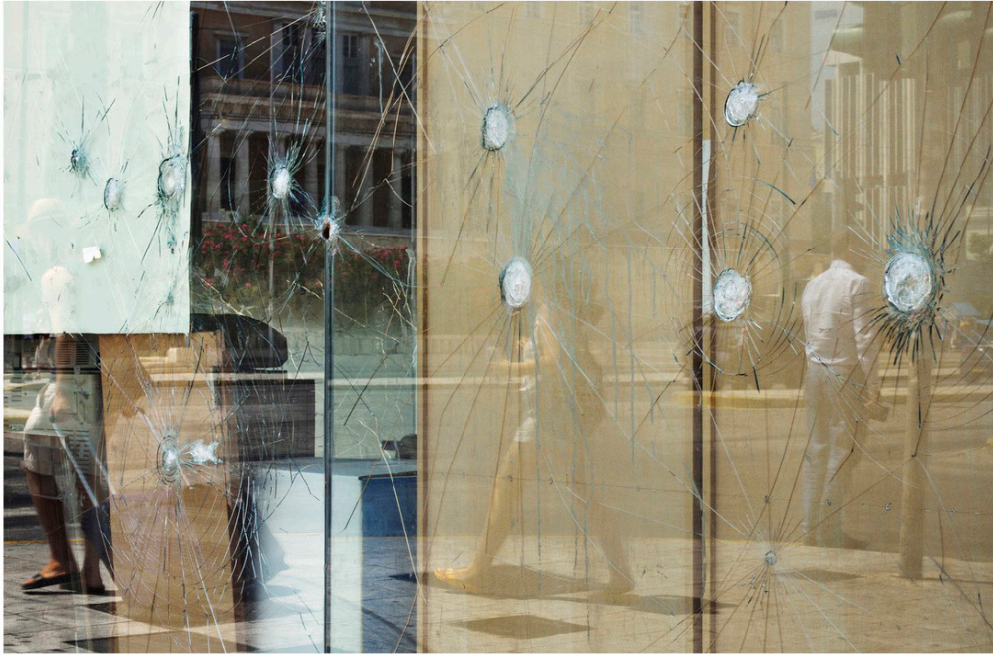
Place Syntagma, Athènes, Grèce, août 2017.