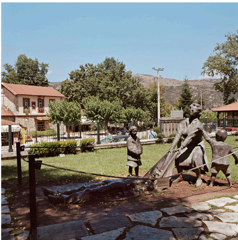
Sculpture érigée en mémoire du massacre de 700 personnes perpétré par les nazis à Kalavrita le 13 décembre 1943, d'après des photographies d'époque, Péloponnèse, août 2018.