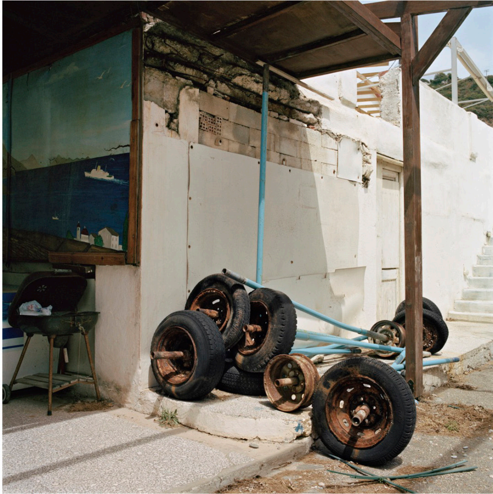
Therma, site thermal depuis l'antiquité, ayant accueilli les exilés communistes lors de la guerre civile (1946-1949), Ikaria, Grèce, 4 avril 2018.