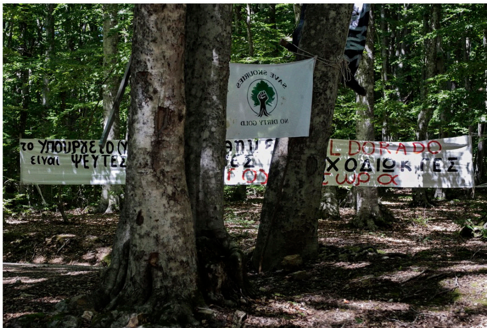
Camp de protestation contre l'ouverture de la mine d'or de Skouries, Grèce, juillet 2017.