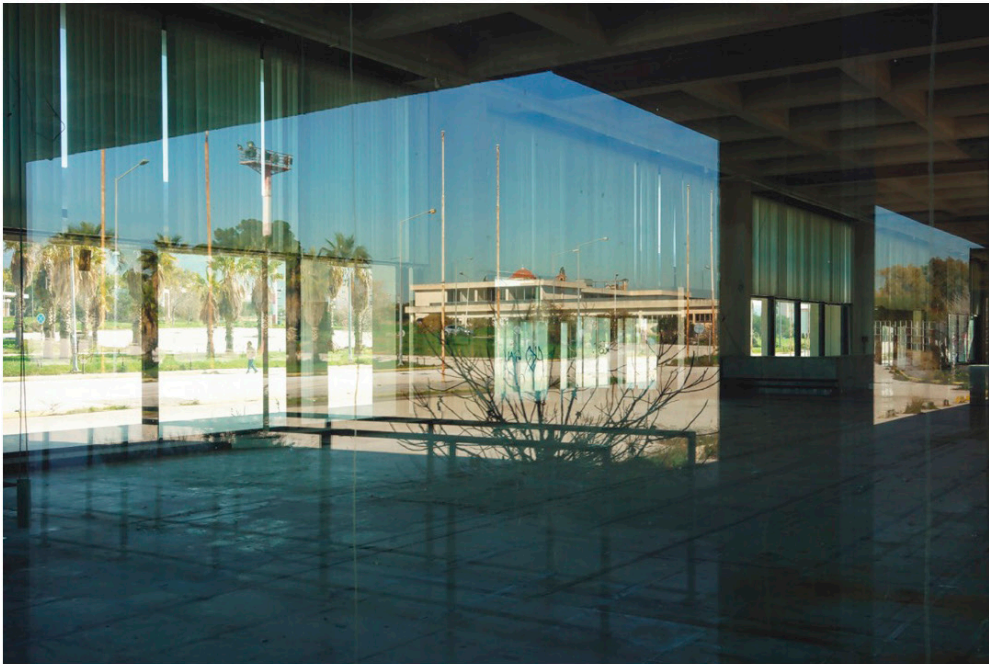
Aéroport abandonné et menacé de destruction, dessiné par Eero Saarinen entre 1960 et 1969, Elliniko, Athènes, Grèce, janvier 2020.