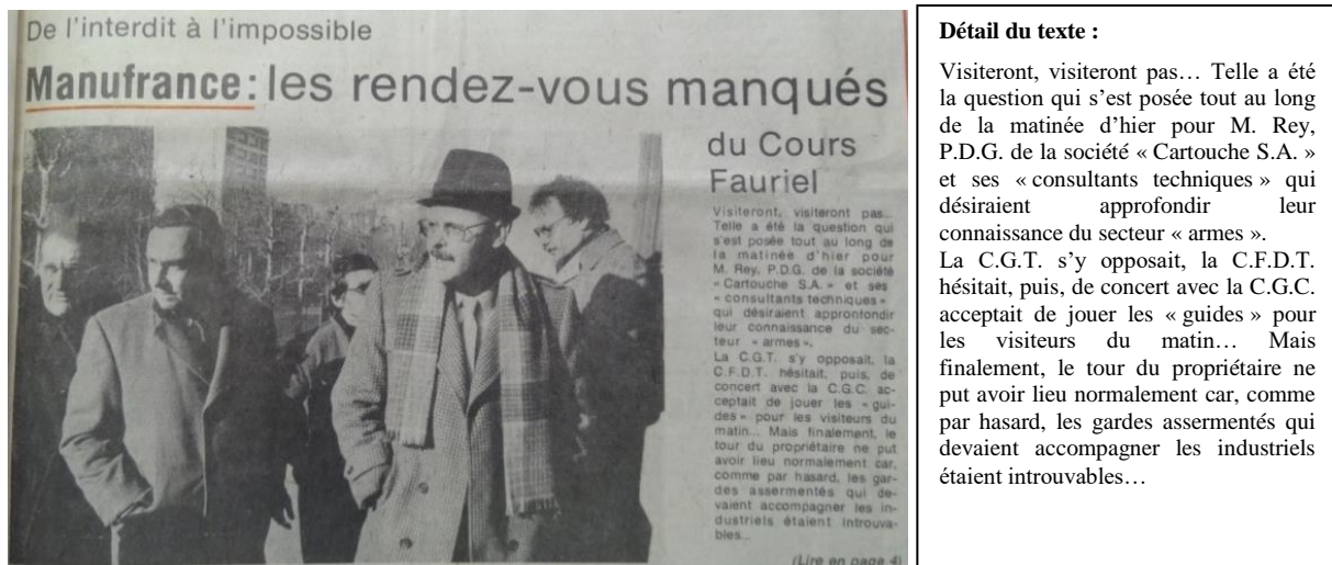
Figure 3 : Loire-Matin, 1er février 1981.

Les usines occupées par les salariés de la coopérative pendant un an, jusqu'à mai 1981, parviennent ainsi à dissuader toute offre de reprise, mais n'empêchent pas pour autant la direction de l'ancienne Manufrance de s'activer à son démantèlement.