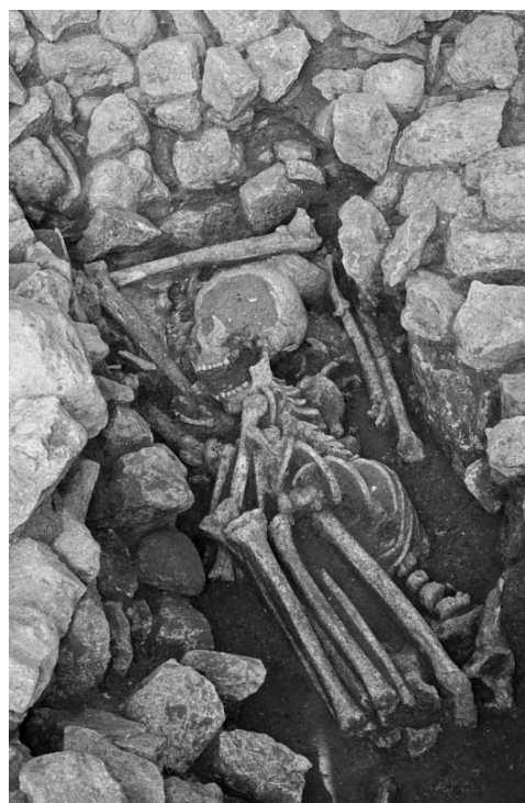
Fig. 3 - Petit Beaulieu, nécropole, coffre funéraire ST4301, vue des inhumés en fond de coffre. Trois individus apparaissent sur le cliché. Datation présumée : Âge du Bronze ancien.

Le mobilier funéraire est très rare : mentionnons un individu avec un poignard et une épingle en alliage cuivreux, une réduction avec un poignard, un corps avec une douzaine de petites perles autour de la tête, une alêne. Quatre dépôts funéraires sont accompagnés d'un récipient en céramique, auxquels nous pouvons ajouter deux vases contenant chacun un périnatal et deux récipients de statut indéterminé, retrouvés dans les fossés d'enclos.