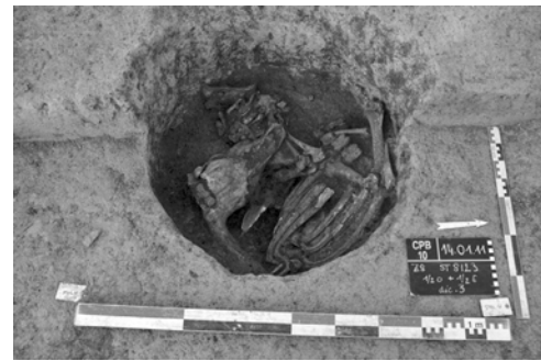
Fig. 4 - Petit Beaulieu, puits ST8123. Aperçu de l'amas de carcasses animales en cours de fouille. Datation : Campaniforme.

Si on considère que plusieurs coffres de la nécropole ont subi des réouvertures pour déposer de nouveaux corps, on est en droit de se demander si les plus anciens inhumés aujourd'hui visibles sont les destinataires de ces architectures, ou, dit autrement, si les monuments funéraires ne sont pas un peu plus anciens que ce que disent les dates radiocarbones. Dans cette hypothèse, la fondation de la nécropole pourrait être contemporaine de l'implantation campaniforme, et l'ensemble des manifestations de cette période (dépôts en puits, monuments funéraires) pourrait expliquer la perdurance du lieu comme nécropole et/ou lieu sacré et la fondation, quelques siècles après, d'un vaste établissement à ses côtés.