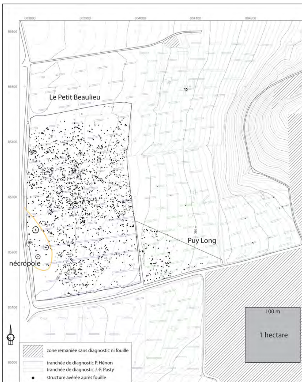
Fig. 1 - Plan masse des chantiers menés à Petit Beaulieu, Clermont-Ferrand (Puy-de-Dôme). Dessin P. Tallet et E. Thirault sur fond topographique C. Bernard & J.B. Caverne et levés Inrap.

Les diagnostics, d'une superficie cumulée de 24 hectares, étaient motivés par deux projets industriels devant bouleverser la topographie du versant, justifiant deux larges prescriptions de fouille de la part de l'Etat. L'occupation devait correspondre à une zone d'habitat caractérisée par des fosses et divers aménagements souterrains, et, éventuellement, des niveaux de sols avec mobilier (fig. 1).