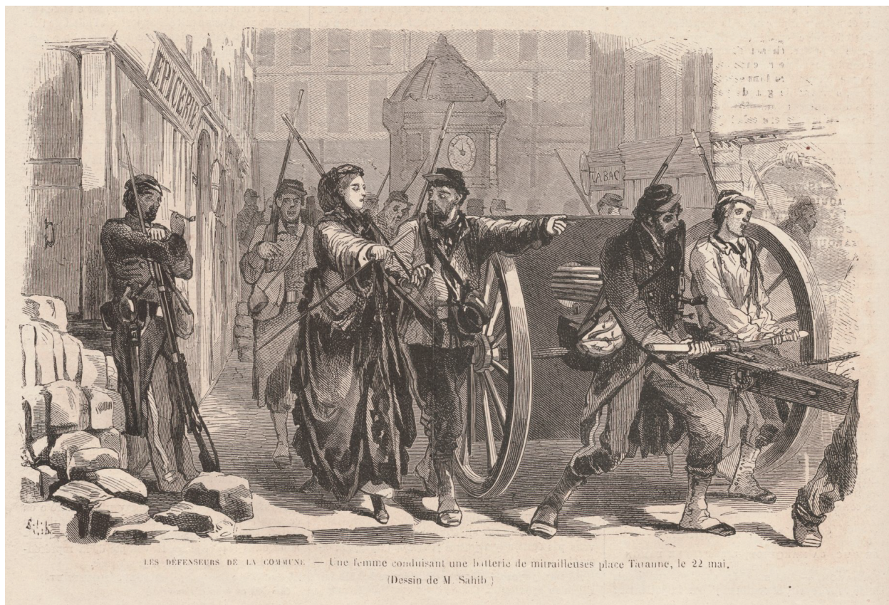
LES DÉFENSEURS DE LA COMMUNE. — Une femme conduisant une batterie de mitrailleuses place Taranne, le 22 mai. (Dessin de M. Sahib.)

Légende : « Les défenseurs de la Commune – Une femme conduisant une batterie de mitrailleuse place Taranne, le 22 mai », illustration de Sahib, Le Monde illustré , 17 juin 1871.