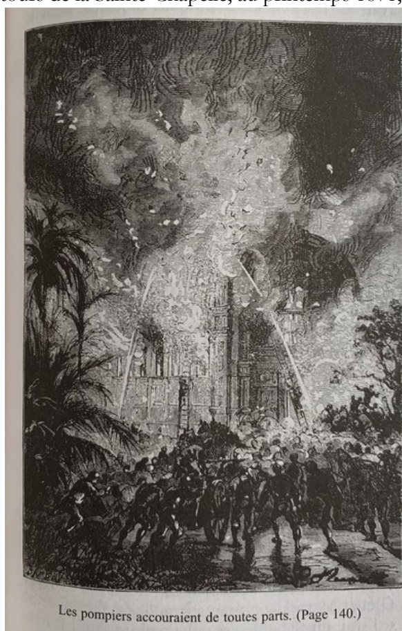
Les pompiers accouraient de toutes parts. (Page 140.)

Les similitudes entre l'imaginaire de la Commune et les descriptions de Stahlstadt incendiée, que cet incendie soit réel ou métaphorique, ne se retrouvent pas seulement dans les techniques scripturales, mais aussi dans l'iconographie du roman, comme le montre la comparaison entre l'illustration de Léon Benett pour la scène de l'incendie de l'atelier des modèles dans Les Cinq Cents Millions de la Bégum , et celle que l'on doit à Chifflard pour l'incendie, bien réel, qui ravagea les alentours de la Sainte-Chapelle, au printemps 1871, et qui frappa durablement alors les esprits :