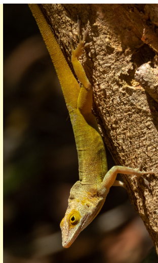
Figure 3 - Ctenonotus terraealtae caryae , photographed in Guadeloupe, at Les Saintes (Terre-de-Bas), in March 2020.

Figure 3 - Ctenonotus terraealtae caryae , photographié en Guadeloupe, aux Saintes (Terre-de-Bas), en mars 2020.