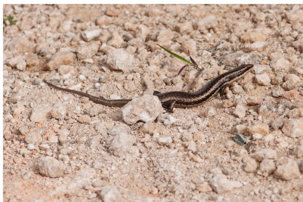
Figure 5 - Mabuya desiradae desiradae , photographié en Guadeloupe, à La Désirade, en juillet 2018.

Miralles et ses collègues (2017) ont considéré que les Mabuya de l'archipel guadeloupéen étaient conspécifiques et pouvaient être regroupés dans l'espèce Mabuya desiradae Hedges et Conn, 2012 (Fig. 5 & 6). Hedges et ses collègues (2019) ont critiqué cette considération et maintiennent