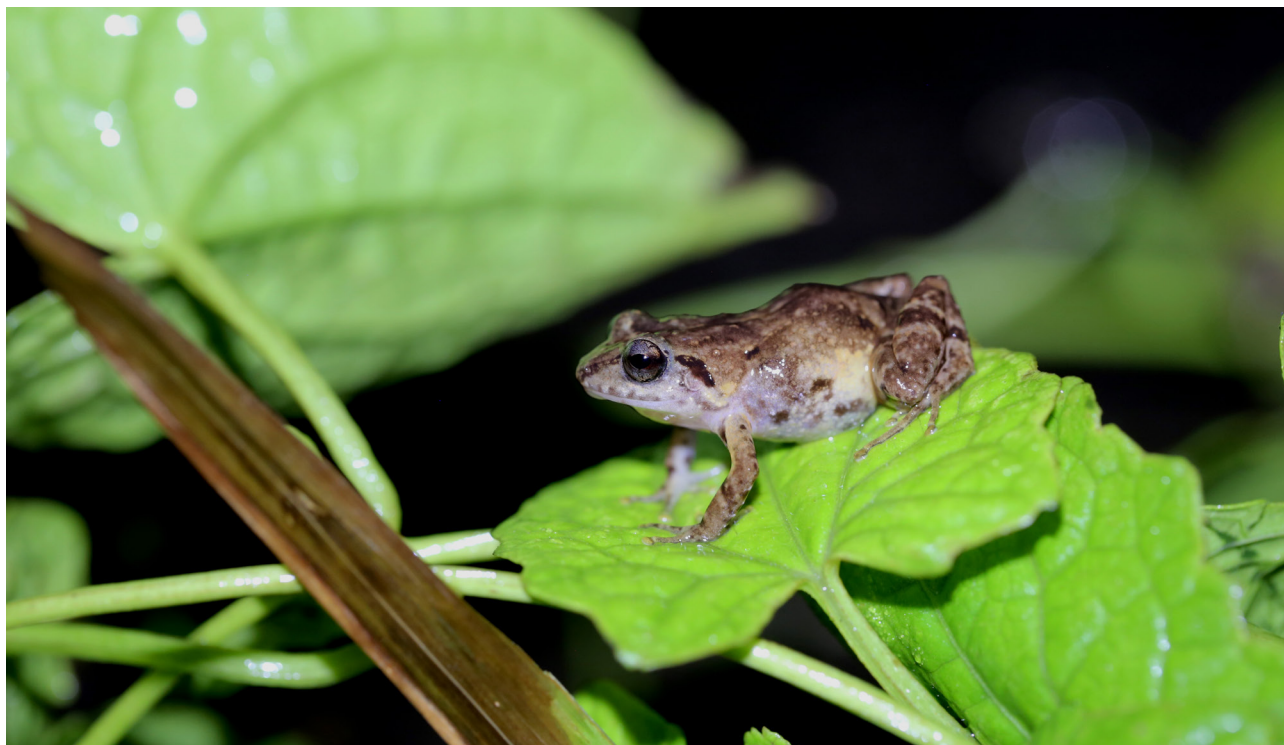
Figure 2 - Eleutherodactylus pinchoni , photographié en Guadeloupe, à Saint-Claude (Basse-Terre), en novembre 2020.

Une étude phylogénétique moléculaire des Éleuthéroductyles des Petites Antilles est nécessaire pour connaître l'origine exacte d' E. martinicensis : Sainte-Lucie, Martinique ou Guadeloupe ? Censky et Kaiser (1999) pensent que l'espèce est originaire de la Martinique.