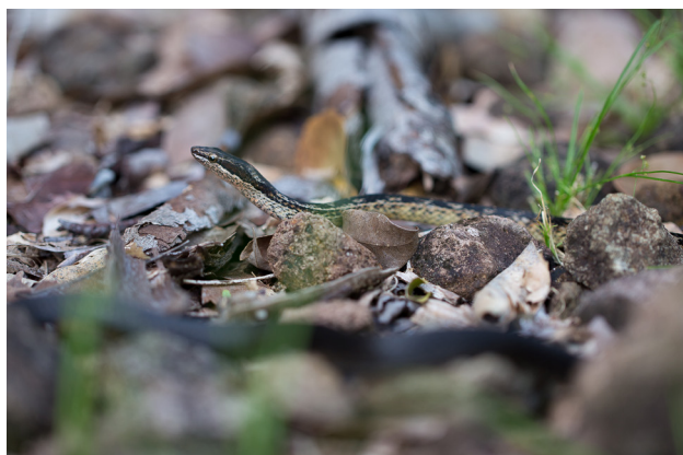
Figure 7 - Alsophis sanctonum danforthi , photographié en Guadeloupe, aux Saintes (Terre-de-Bas), en décembre 2016.

Il existe des mentions erronées de restes subfossiles attribués à Clelia en Guadeloupe (Bochaton comm. pers. in Lescure et al. 2020), ce taxon n'y a en réalité jamais été identifié dans le registre fossile. Cependant, Breuil (2002) pose la question de l'existence passée d'une longue Couleuvre noire « hardie » en Guadeloupe, à partir d'un texte évocateur du Père Du Tertre (1667) (voir Dewynter et al. 2019). Le témoignage du Père Labat (1722), que Breuil cite sur cette possible présence dans les temps historiques sur une autre île que Sainte-Lucie, ne concerne que la Martinique.