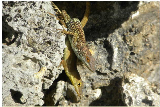
Figure 4 - Ctenonotus marmoratus chrysops , photographié en Guadeloupe, à La Petite Terre, en mai 2010.

Figure 4 - Ctenonotus marmoratus chrysops , photographed in Guadeloupe, at La Petite Terre, in May 2010.