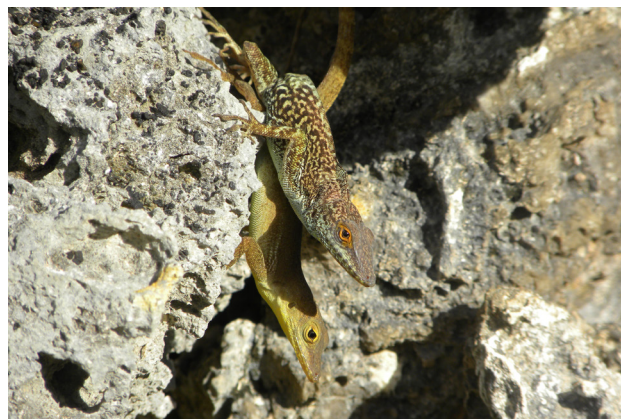
Figure 4 - Ctenonotus marmoratus chrysops , photographié en Guadeloupe, à La Petite Terre, en mai 2010.

Figure 4 - Ctenonotus marmoratus chrysops , photographed in Guadeloupe, at La Petite Terre, in May 2010.