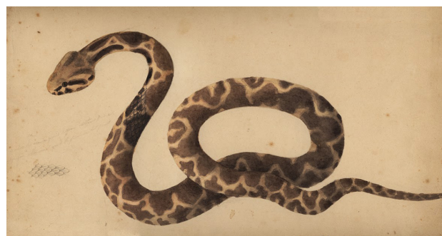
Figure 9 - Daboia mauritanica , la Vipère de Maurétanie, d'après un dessin d'Antoine Jean Baptiste Vaillant (planche 3 extraite de Guichenot 1850).

L'holotype de Clotho mauritanica Gray, 1849 et d' Echidna mauritanica Guichenot, 1850, devenue Daboia mauritanica (Gray, 1849), MNHN-RA-0.4117, est toujours dans les collections du Muséum national d'Histoire naturelle de Paris. Il a été dessiné par Antoine Jean Baptiste Vaillant [1817-1852] (Fig. 9). Echidna mauritanica Guichenot est bien daté de 1850 (David & Ineich 1999, Thierry Frétey comm. pers.) et non de 1848 comme l'ont cru certains (Golay et al. 1993).