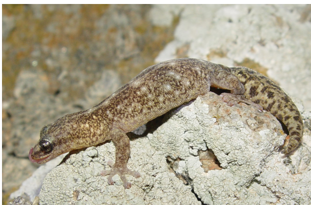
Figure 5 - Euleptes europaea , photographié en Tunisie à Gallo, île des chiens, Archipel de La Galite, en mars 2008.

Euleptes europaea (Fig. 5), le « gecko » si particulier de certaines îles de la Méditerranée occidentale, est aussi présent en Tunisie, mais seulement sur trois petites îles de l'archipel de La Galite, situé à l'extrême nord du pays (Delaugerre et al. 2011, Delaugerre & Corti 2020).