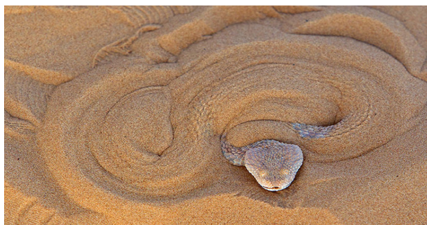
Figure 8 - Cerastes vipera , photographié en Tunisie, dans le Parc national de Jbil, en mars 2011.