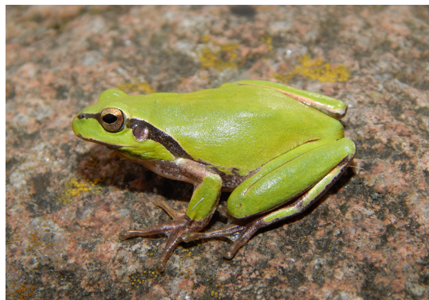
Figure 3 - Hyla carthaginiensis , mâle photographié en Tunisie, à Lebna, mai 2015.

ont relaté aussi les différences entre les Rainettes de Tunisie et les autres Rainettes méridionales, mais leur Hyla numidica est un synonyme plus récent de Hyla carthaginiensis (Dufresnes et al. 2019a), c'est d'ailleurs un nom indisponible selon le code international de Nomenclature zoologique, car il a été décrit sans désignation de matériel type (Dufresnes & Crochet 2020).