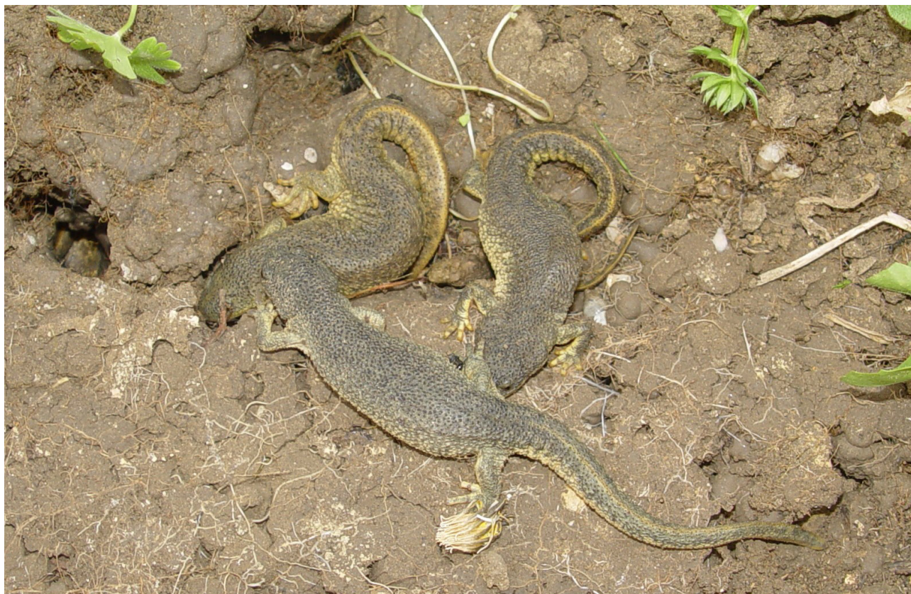
Figure 4 - Pleurodeles nebulosus , photographié en Tunisie à Om Hani, Menzel Bourguiba, Bizerte, en janvier 2009.