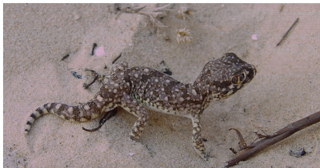
Figure 6 - Stenodactylus mauritanicus , photographié en Tunisie, dans l'Oued Laabid, cap Bon, en septembre 2006.

du Sahara et les autres S. petrii de la Mauritanie à la Tunisie. Pour le moment nous conservons donc une seule espèce dans ce complexe ( S. petrii , incluant stenurus ) en attendant des résultats complémentaires. Cependant, le fait que les S. petrii de Tunisie soient génétiquement plus proches des S. petrii de Mauritanie et du Maroc que du spécimen de stenurus de Tunisie soutient la validité du taxon stenurus . Cette position, même si elle est faiblement appuyée, suggère que S. petrii puisse constituer un complexe d'espèces.