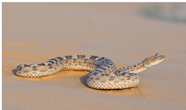
Figure 7 - Cerastes cerastes , photographié en Tunisie, dans le Parc national de Jbil, en mars 2011.

Une autre espèce, Cerastes boehmei , a été décrite en 2010 par Wagner et Wilms à partir d'un seul exemplaire du centre de la Tunisie repéré dans la collection du Muséum Alexander Koenig à Bonn. Cette espèce est mentionnée par Wallach et al. (2014). Cependant, comme l'un d'entre nous l'a déjà écrit (Geniez 2015) : « nous considérons Cerastes boehmei comme un synonyme junior de Cerastes vipera et l'unique spécimen connu comme une Cerastes vipera montrant une rare anomalie d'écaillure ».