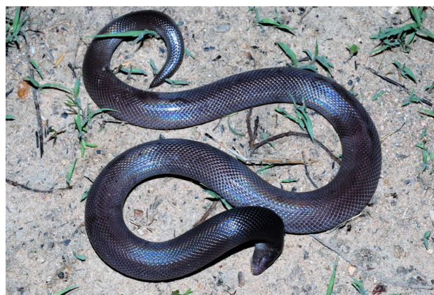
Figure 3 - Atractaspis dahomeyensis . Spécimen de Baïbokoum (Tchad).

Quatorze spécimens ont été étudiés, dont six provenaient du Mali, quatre du Togo et quatre du Tchad (Tableau III). Quatre spécimens (28,6%) présentaient une ou plusieurs proies dans leur tube digestif, mais celles-ci n'étaient identifiables que chez trois spécimens (21,4%). Un spécimen du Togo présentait un œuf de reptile, probablement un œuf de serpent, de 5,2 cm de long. Un autre spécimen du Togo présentait à la fois un œuf de reptile de 3,6 cm de long et un spécimen nouveau-né du Colubridé Philothamnus irregularis (Leach, 1819). Enfin, un spécimen du Tchad avait ingurgité un amphibien.