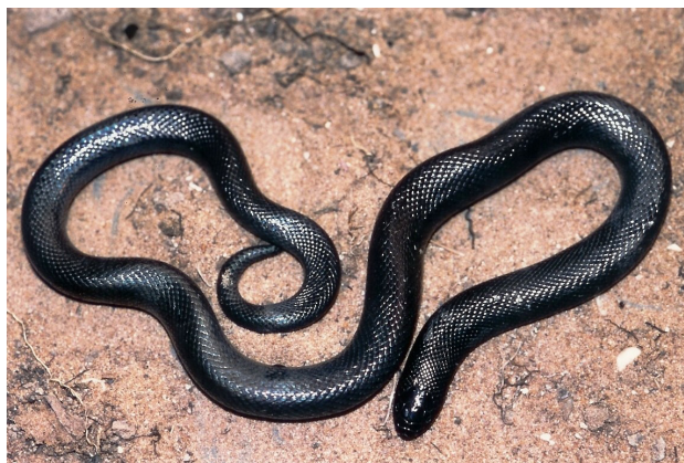
Figure 4 - Atractaspis microlepidota . Spécimen de Dielmo (Sénégal).

Onze spécimens ont été étudiés, tous provenant du Sénégal (Tableau IV). Sept spécimens (63,6 %) présentaient une proie dans leur tube digestif, mais celle-ci n'était identifiable que chez cinq spécimens (45,5%). Dans trois cas il s'agissait de crapauds Sclerophrys xeros , dans un cas du serpent Psammophis afroccidentalis Trape, Böhme & Mediannikov, 2019, ce dernier plus long que son prédateur, et dans un cas du Lacertidé Latastia longicaudata (Reuss, 1834).