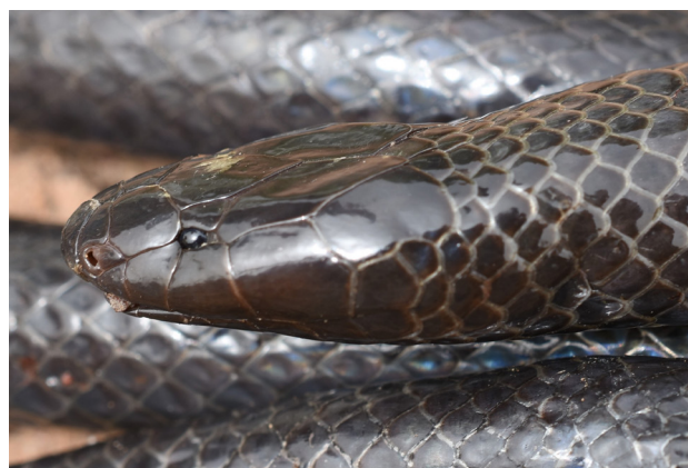
Figure 1 - Amblyodipsas unicolor . Spécimen de Moïssala (Tchad).

Dix-huit spécimens ont été étudiés, dont dix du Sénégal, quatre du Mali, trois du Tchad et un du Bénin (Tableau I). Huit spécimens (44,4 %) présentaient une ou plusieurs proies dans leur tube digestif. Pour les sept cas (38,9 %) où la proie était identifiable, il s'agissait de reptiles dans quatre cas (57,1 %) et d'amphibiens dans trois cas (42,9 %). Les reptiles étaient représentés par un serpent Typhlopidé (écailles d' Afrotyphlops sp.), un amphispène ( Cynisca leucura Duméril & Bibron, 1839) et deux lézards indéterminés dont il ne restait que quelques griffes et écailles non digérées.