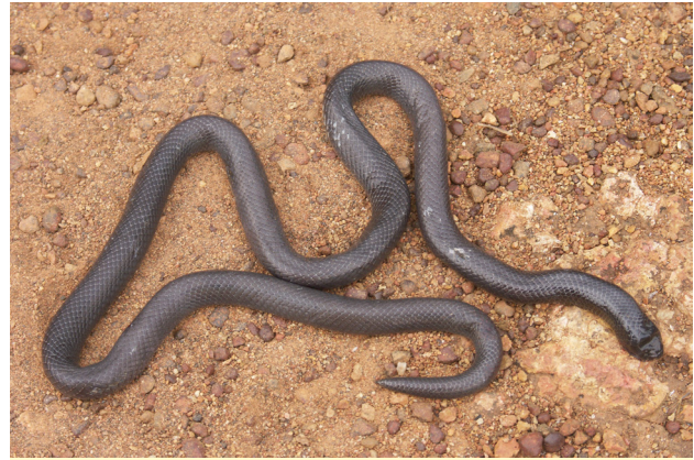
Figure 2 - Atractaspis aterrima . Spécimen de Sérissou (Guinée).

Dix-sept spécimens ont été étudiés, dont 14 du Sénégal et trois du Mali (Tableau II). Sept spécimens (41,2 %) présentaient une proie dans leur tube digestif. Dans les cinq cas où la proie était identifiable (35,7%) il s'agissait de reptiles, dont trois cas de Typhlopidés ( Afrotyphlops lineolatus Jan, 1863, dans deux cas et Afrotyphlops sp. dans un cas) et deux cas de lézards indéterminés pour lesquels il ne restait que quelques griffes ou écailles non digérées.