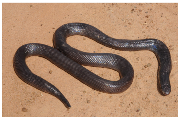
Figure 6 - Atractaspis watsoni . Spécimen de Balani (Tchad).