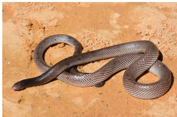
Figure 5 – Atractaspis micropholis . Spécimen de Kayar (Sénégal).

Les lézards identifiables étaient dans dix cas le Lacertidé Latastia longicaudata et dans un cas le Varanidé Varanus exanthematicus (Bosc, 1792).