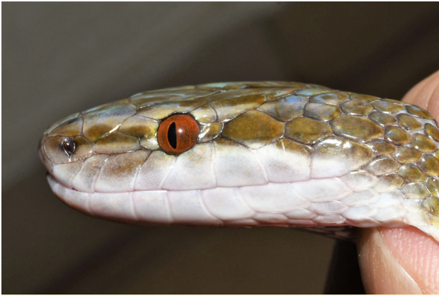
Figure 4 - Vue dorso-latérale de la tête de l'holotype de Boaedon montanus sp. nov.