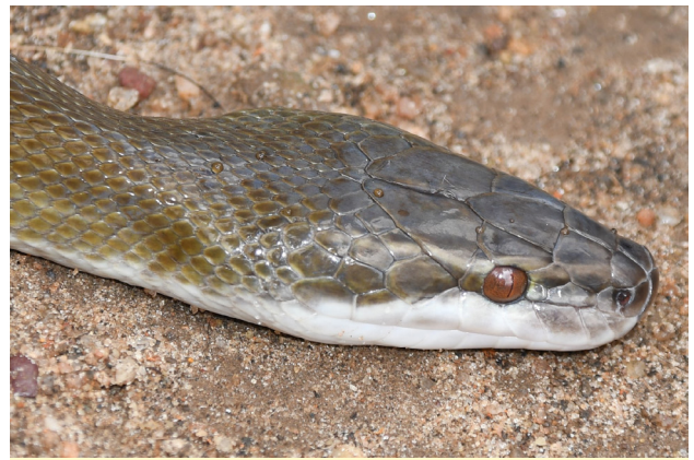
Figure 8 - Vue latérale de la tête de l'holotype de Boaedon montanus sp. nov.