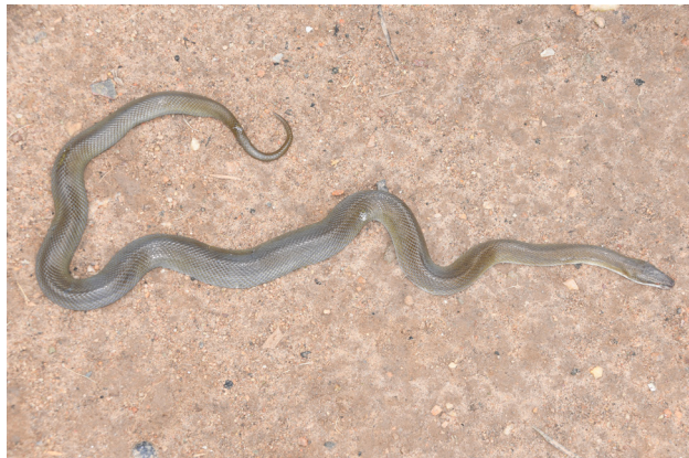
Figure 2 – Vue générale de l'holotype de Boaedon montanus sp. nov. en vie.

Boédon de montagne – Mountain House Snake (Fig. 2)