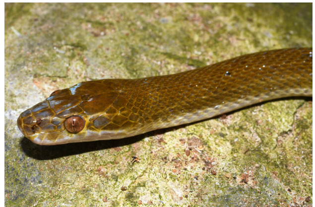
Figure 9 - Vue de la tête et de la partie antérieure du corps du paratype mâle MNHN 2022.0006 de Boaedon montanus sp. nov. en vie.