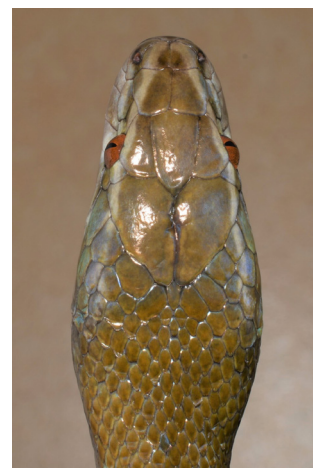
Figure 3 – Vue dorsale de la tête de l'holotype de Boaedon montanus sp. nov.

La tête mesure 30 mm de long et sa plus grande largeur est de 16 mm (Fig. 3). Elle est bien distincte du corps. L'œil, dont le diamètre vertical est de 3,3 mm et le diamètre horizontal de 3,4 mm, possède une pupille verticale (Fig. 4). La distance entre l'œil et l'extrémité du museau est de 12 mm. Celle entre l'œil et le rebord de la lèvre est de 3,0 mm. La rostrale est peu apparente en vue latérale et dorsale (Fig. 5). Les préfrontales sont 1,6 fois plus longues que les internasales et nettement plus larges.