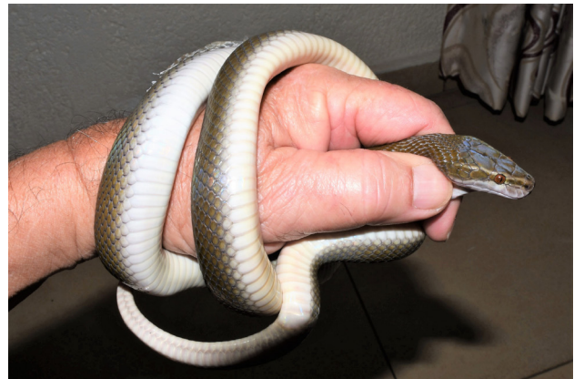
Figure 7 - Vue latérale de l'holotype de Boaedon montanus sp. nov.