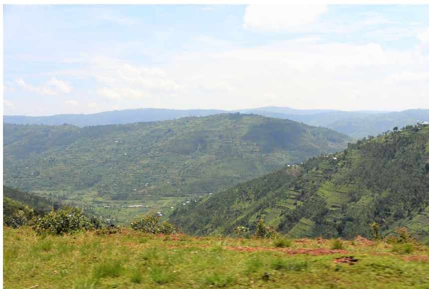
Figure 10 – Habitat de Boaedon montanus sp. nov. en zone rurale près de Kigali (Rwanda).

Nous adressons nos vifs remerciements à Youssouph Mané pour sa participation aux collectes et à l'étude des spécimens de B. fuliginosus et B. lineatus d'Afrique de l'Ouest, à Morris Flecks pour l'examen des paratypes de B. montanus sp. nov. conservés à Bonn, à Wolfgang Böhme pour d'utiles remarques sur une version préliminaire du manuscrit et à Hacène Medkour et Meriem Louni pour leur précieuse aide technique concernant la partie moléculaire de ce travail.