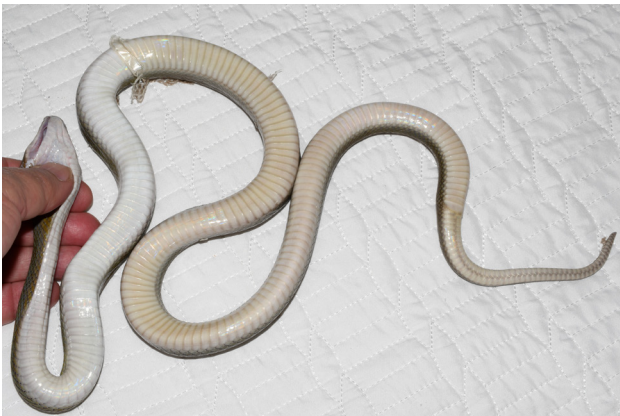
Figure 6 - Vue ventrale de l'holotype de Boaedon montanus sp. nov.