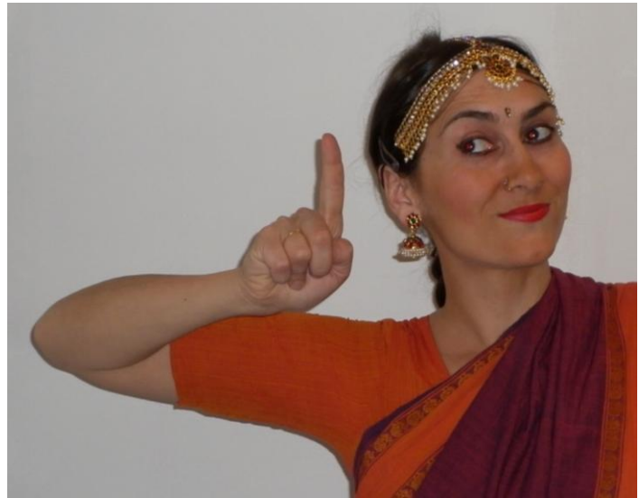
mûdra : suchi

Et lorsque le danseur montre le nombre 1000 avec la même mûdra , on retrouve un motif connu, qui sans avoir le même sens crée un agréable effet de répétition, ce qui pourrait faire penser à une rime dans un poème.