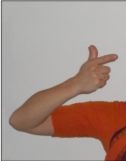
mûdra : chandra kala