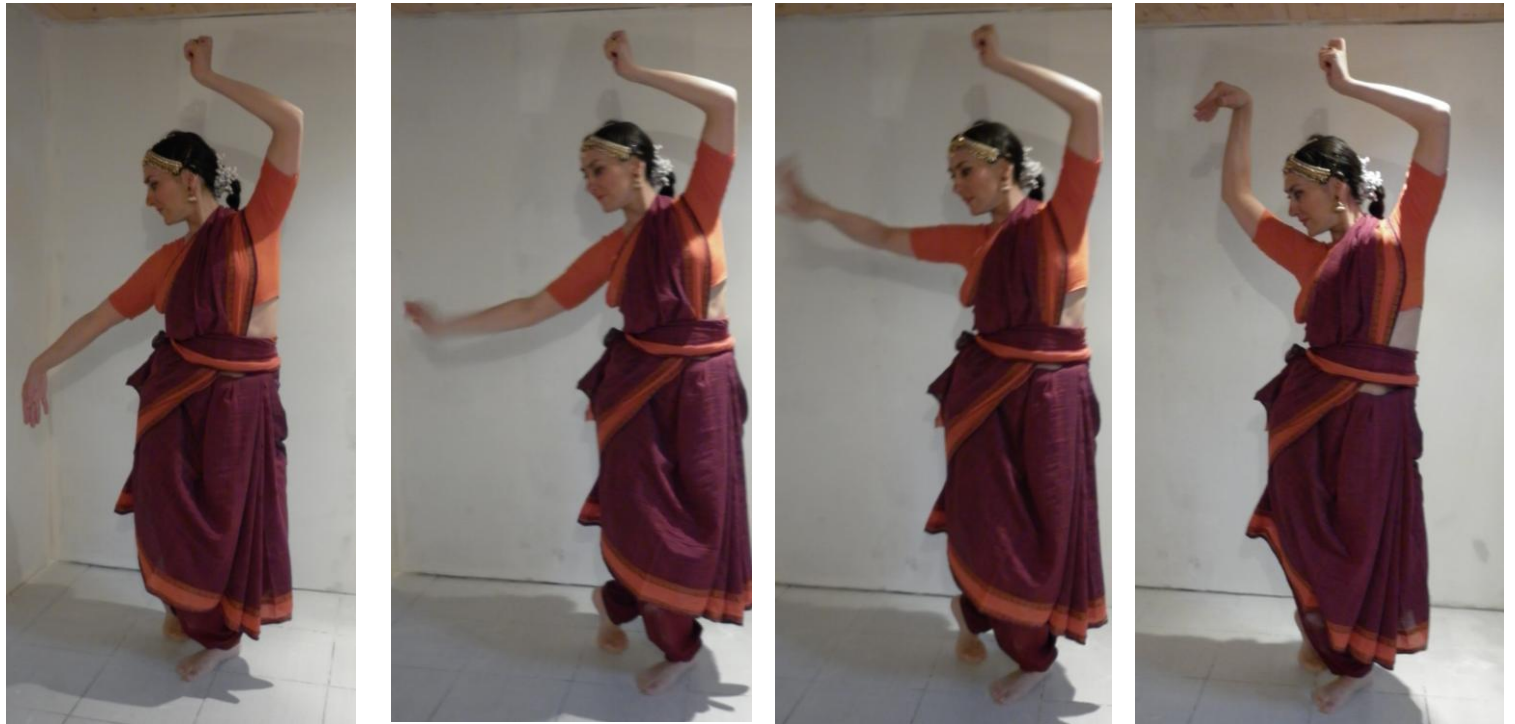
Shiva, celui dont la rivière Gange coule du chignon.

Dans certaines occurrences, l'acteur-danseur peut aussi enchaîner des pas de « danse pure » sans narration, choisis pour leur vigueur et leur souplesse.