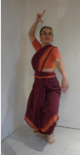
La danseuse se prépare à entrer en scène quand la seconde phrase de chant se lance : Shiva, avec la lune dans le chignon.

En ce qui concerne la version de Sivaselvi Sarkar, la configuration est différente, car le morceau musical commence tout de suite avec la phrase chantée. Du coup, comme l'acteur-danseur laisse une phrase avant d'entrer sur scène, c'est le chant qui raconte, et crée ainsi un effet d'attente.