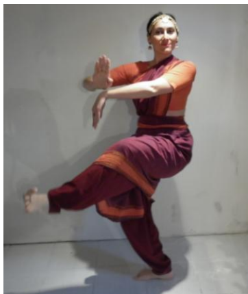
Posture classique de Shiva Nataraja , ou « seigneur de la danse »