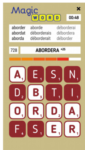
(a) MagicWord [8]

L'objectif du projet Lex:gaMe est d'améliorer les compétences lexicales des étudiants universitaires. Il s'articule autour de la conception d'une base lexicale à laquelle pourront être connectés deux jeux lexicaux déjà partiellement développés par d'autres membres du projet. La base lexicale permettra aux apprenants de rechercher des mots (tel un dictionnaire) et proposera des fonctionnalités dédiées à l'apprentissage (carnet de vocabulaire partagé, statistiques personnelles, révision de listes de mots...). Les deux jeux en question sont MagicWord (voir Fig. 1a) qui consiste à trouver des mots dans une grille de 16 cases (4×4) contenant des lettres et Game of Words (voir Fig. 1a) reposant sur le principe du Taboo [9] : un joueur reçoit un mot, enregistre une définition orale sans utiliser les mots interdits; un deuxième joueur aura la tâche de vérifier que l'enregistrement est valide et respecte bien les consignes; enfin le dernier joueur doit deviner le mot initial d'après la définition. MagicWord cible des connaissances lexicales de bas niveau (e.g. forme du mot, morphologie) [8] quand Game of Words se focalise sur des connaissances lexicales de haut niveau (e.g. sens, utilisation).