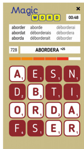
(a) MagicWord [8]

L'objectif du projet Lex:gaMe est d'améliorer les compétences lexicales des étudiants universitaires. Il s'articule autour de la conception d'une base lexicale à laquelle pourront être connectés deux jeux lexicaux déjà partiellement développés par d'autres membres du projet. La base lexicale permettra aux apprenants de rechercher des mots (tel un dictionnaire) et proposera des fonctionnalités dédiées à l'apprentissage (carnet de vocabulaire partagé, statistiques personnelles, révision de listes de mots...). Les deux jeux en question sont MagicWord (voir Fig. 1a) qui consiste à trouver des mots dans une grille de 16 cases (4×4) contenant des lettres et Game of Words (voir Fig. 1a) reposant sur le principe du Taboo [9] : un joueur reçoit un mot, enregistre une définition orale sans utiliser les mots interdits; un deuxième joueur aura la tâche de vérifier que l'enregistrement est valide et respecte bien les consignes; enfin le dernier joueur doit deviner le mot initial d'après la définition. MagicWord cible des connaissances lexicales de bas niveau (e.g. forme du mot, morphologie) [8] quand Game of Words se focalise sur des connaissances lexicales de haut niveau (e.g. sens, utilisation).