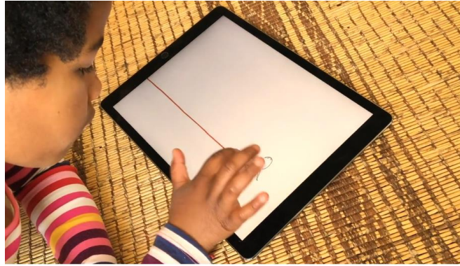
Capture d'écran de la bande-annonce de Moi j'attends ( https://www.mojattends.fr/ )

Sur La Grande Histoire d'un petit trait , les actions sollicitées auprès de l'utilisateur sont plus développées puisque, conformément à l'esprit de l'histoire qui conte le rôle de l'expression graphique dans le destin d'un petit garçon, chaque séquence suppose qu'un dessin – libre ou suggéré par des pointillés – soit réalisé pour permettre au récit de se poursuivre.