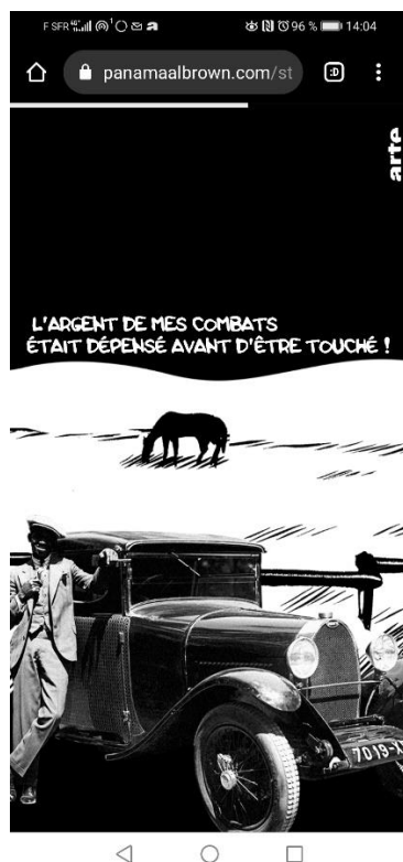
Capture d'écran de Panama Al Brown, round 4, chapitre « Le coup de foudre », case n° 4.