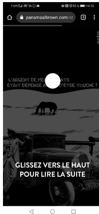
Capture d'écran de Panama Al Brown, Épilogue, chapitre « Une étoile filante », case n° 25

fractionnée : « Je voulais que ce soit une histoire qui puisse se lire en plusieurs fois, parce que c'est rare de disposer de 45 minutes en continu sur son téléphone. » Cette intention se concrétise par une autonomie concédée dans le déroulement successif des cases, par un simple « scroll » vertical, classique dans l'univers de la BD numérique, fortement marquée par le modèle de la BD-diaporama de substitution (Paolucci, 2020, p. 21). Ces gestes, selon les concepteurs de livres numériques, permettraient de « pallier la perte de la sensualité livresque », et « pousseraient les usagers à adopter spontanément “un comportement de lecture” » (Tréhondart, 2018, p. 676).