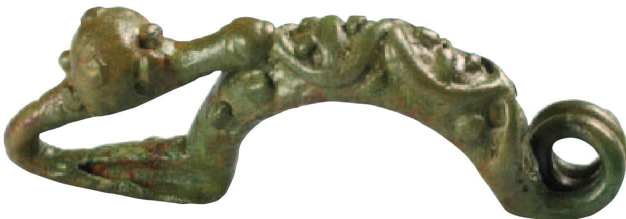
Fibule en alliage cuivreux laténienne provenant du sanctuaire de Juvigné, ornée de la tête d'un palmipède.