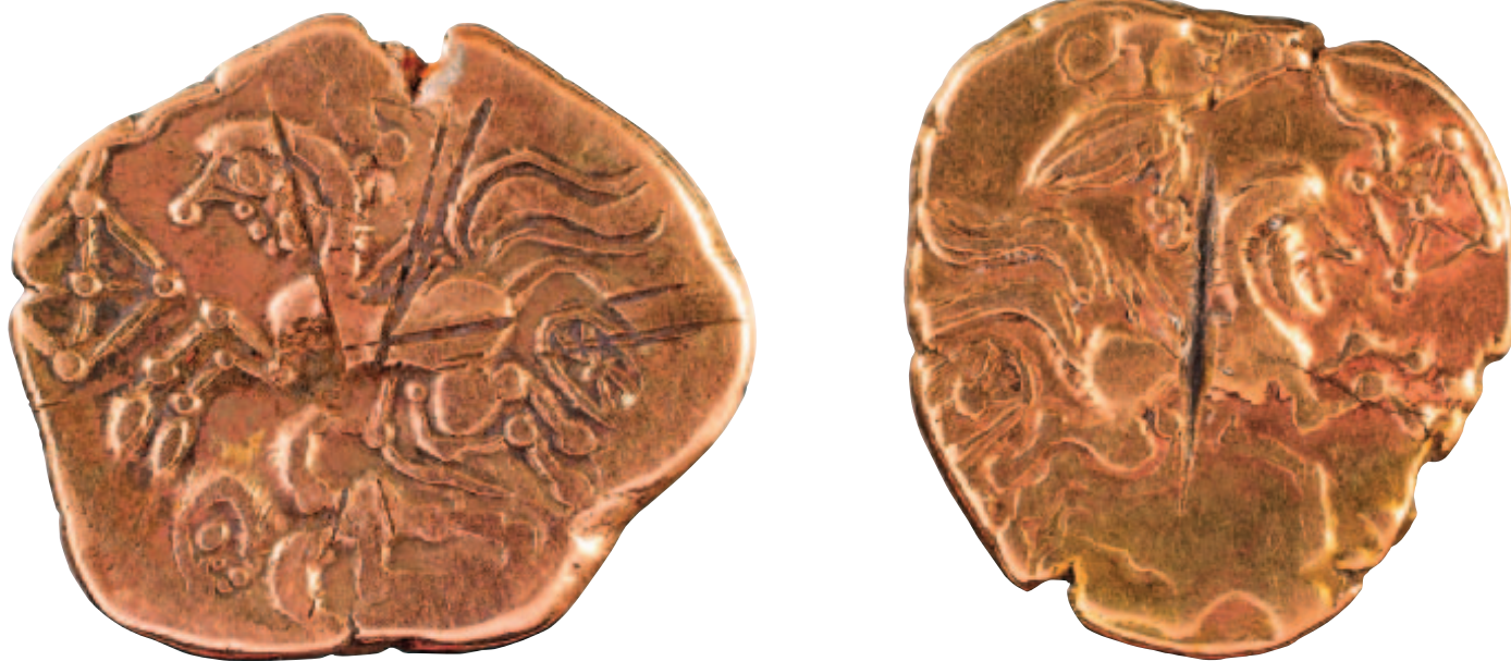
Statères en or alliés des Aulerques Cénomans, mutilés à coups de burin et déposés au sanctuaire de Juvigné.

jusqu'à 3 m de profondeur, ce fossé était vraisemblablement doublé d'un talus marquant le paysage, édifié avec la terre récupérée lors de son creusement. Vers le milieu du I er siècle après J.-C., les fondations d'un mur maçonné, ancrées au fond de ce fossé, et en reprenant alors le tracé exact, sont interprétées comme le péribole du lieu de culte d'époque romaine. Même si la datation précise du creusement du fossé demeure hypothétique, puisque son comblement a piégé du mobilier à la fois gaulois et gallo-romain, la volonté de conserver, au cours du temps, la même limite pour l'aire sacrée est manifeste et constitue un indice fort de la permanence de la vocation religieuse du site. Ce dispositif n'a été repéré pour l'instant qu'à l'est du temple, sur une trentaine de mètres, mais plusieurs indices suggèrent que le fossé, transformé plus tard en une enceinte maçonnée, formait un quadrilatère s'étendant sur une centaine de mètres de long. Ce phénomène de maintien du contour de l'espace sacré est connu sur d'autres sanctuaires gaulois, transformés par la suite en lieux de culte gallo-romains.