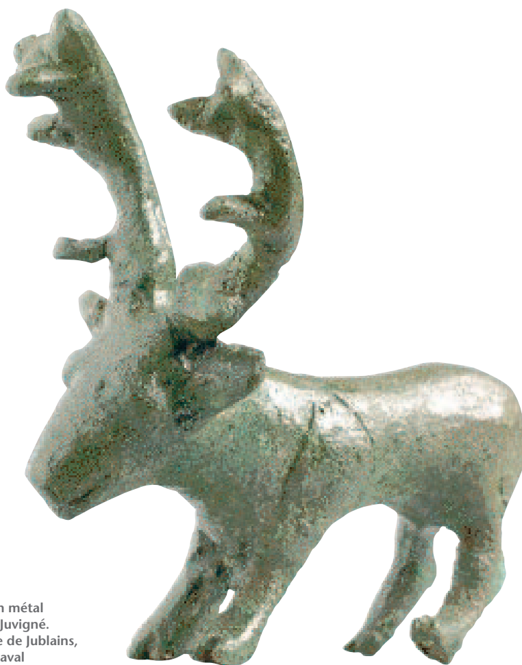
Statuette de cervidé, en métal cuivreux, découverte à Juvigné.

Les découvertes effectuées à Juvigné, dans les Pays de la Loire en Mayenne, ont révélé l'existence d'un lieu de culte fréquenté pendant plusieurs siècles. Statuettes, monnaies, armement et objets de parure témoignent de la continuité de pratiques religieuses depuis la période gauloise jusqu'à l'époque gallo-romaine, enrichissant le dossier encore peu étoffé des sanctuaires laténiens de l'ouest de la France.