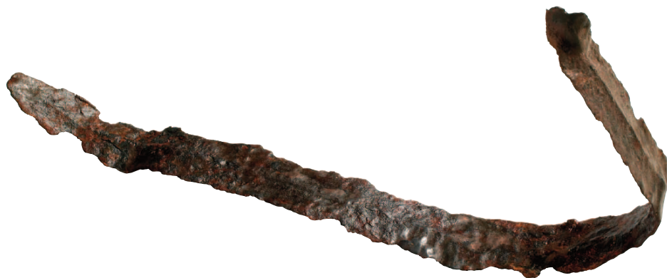
Épée gauloise en fer ployée provenant du sanctuaire de Jublains (Mayenne).