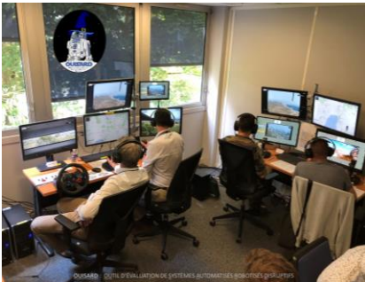
Figure 2 : Salle OUISARD

La répartition des tâches entre humain et robot n'est pas uniquement technologique mais aussi contextuelle ; certaines phases de mission nécessiteront toujours un contrôle fin et d'autre une supervision macroscopique des robots.