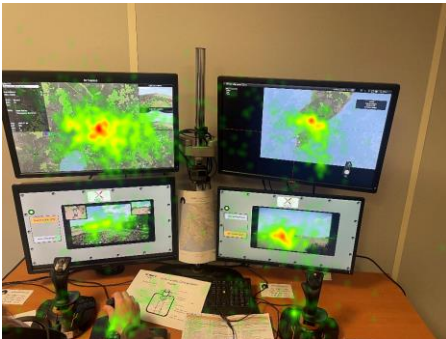
Figure 3 : Carte de chaleur issue de l'analyse des données d'EyeTracking

Identification du moment et du pourquoi les opérateurs reprennent le contrôle de leur robot. Les principales raisons mises en exergue semblent être le manque de confiance vis-à-vis des robots pour la réalisation de tâches délicates (ou nécessitant une expertise opérationnelle) et le fait qu'il est parfois plus rapide de réaliser une action soi-même que de la verbaliser et de l'expliquer au robot pour qu'il la réalise.