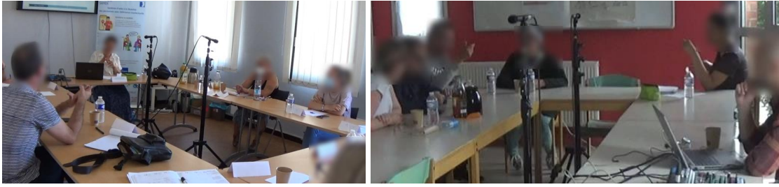
Figure 2. Sessions de focus groupe (gauche : professionnels, droite : personnes avec DI)

Après ces sessions, une aide à la navigation qui réponde à ces besoins tout en s'adaptant aux individualités de notre population cible s'est avérée nécessaire et attendue. En parallèle de ces travaux, des études de technologies sont effectuées et décrites dans la section suivante.