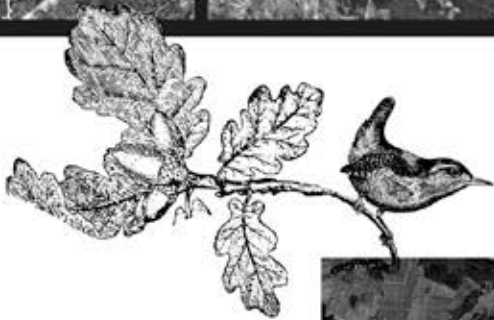
Forêts et vignes Autour de Pouillé