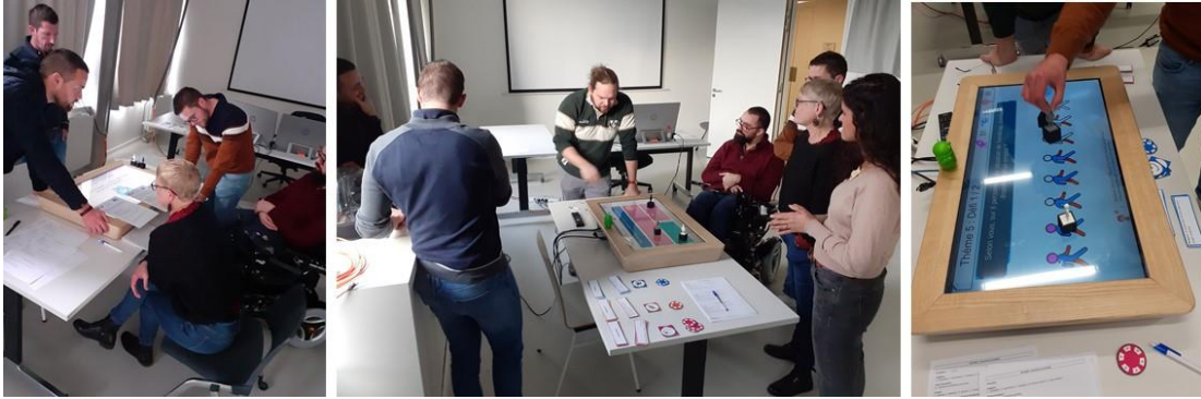
Figure 3: SG-HANDI en cours d'évaluation préliminaire