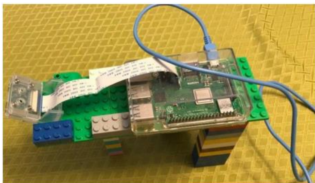
Figure 1 - Aperçu du prototype du système intégré

Pour reconnaître la présence d'objets, le système effectue la détection du niveau de gris des captures d'images avec seuillage paramétrable. Ensuite, il vérifie que les images modifiées des objets ont quatre contours et enfin que l'aire de chacune d'elles est comprise entre une valeur minimale et une valeur maximale. Quant à l'évaluation de l'intervalle de temps entre deux images d'objets, le système garde en mémoire les différents moments de capture d'image et traite ensuite cette information. L'intervalle de temps entre la présence de deux objets détectés correspond au temps d'attente qui s'est écoulé entre leurs passages devant la caméra.