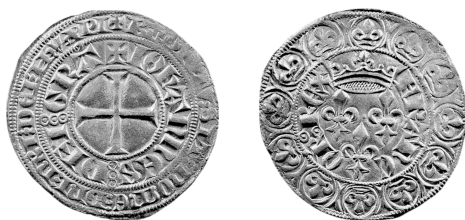
Figure 24 - Gros aux trois lis, 4 e émission (iNumis, VSO 1, n° 530).

à les considérer comme étant de la 4 e émission (figure 24). Nous estimons que la 4 e émission particulière n'a pas donné lieu à l'établissement de différent particulier.