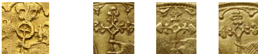
Figure 10 - Cerclage de la hampe du pseudo-double mouton (g.) et de trois moutons officiels (d.).