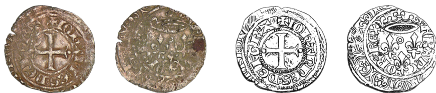
Figure 28 - Gros aux trois lis, 8 e émission (Monnaie d'Antan, VAE 10, n° 237 ; SAULCY 1880, n° 72).