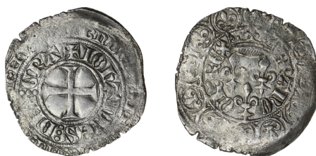
Figure 25 - Gros aux trois lis, 5 e émission (BnF, MMA, Z820).