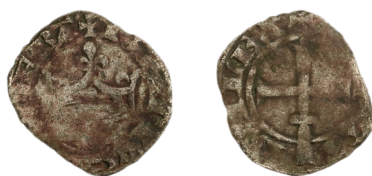
Figure 51 - Double denier tournois «à la couronne sur barre annelée», juin 1359, 1,37 g, 22 mm (CGB bry_447931).

Les doubles deniers tournois ordonnés en juin 1359 doivent être considérés comme une seconde émission de ceux décidés le 12 mai 1359, en raison de l'affaiblissement de titre et de poids qui les distingue. Le différent de cette émission a pu être observé sur quelques rares exemplaires, de conservation médiocre : au droit, un besant sous la base annelée ; au revers, un besant au sommet de la croix (figure 51). Ce différent d'émission a été publié pour la première fois par Jean-Philippe Cormier, avec une attribution au 22 août 1358 122 . Les deux exemplaires référencés à ce jour n'ont pas de provenance précise, mais l'un a été acquis auprès d'un marchand du Sud, et l'autre n'a pas de provenance connue 123 . Un dernier argument, pondéral, vient à notre sens appuyer cette identification. Alors que les exemplaires de la 1 re émission de ce double tournois ont une masse comprise entre 1,10 et 1,37 g (poids théorique de 1,398 g), les deux exemplaires que nous proposons d'attribuer à la 2 e émission pèsent 1,37 et 1,40 g (poids théorique de 1,529 g). Le corpus est certes réduit, et les monnaies sont en piètre état, mais la masse du flan semble bien augmenter entre les deux émissions. Or, il s'agit-là d'un cas de figure exceptionnel pour les monnaies noires de Jean II, et le rattachement de ce double tournois au monnayage languedocien de 1359 nous paraît la seule attribution possible.