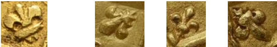
Figure 14 - Lis en cantonnement du pseudo-double mouton (g.) et de trois moutons officiels (d.).