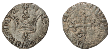
Figure 35 - Double denier tournois « à la couronne sur un lis », fin octobre 1356, 1,35 g, poids fort, 21 mm (BnF, MMA N6973).

D/ +IOHANNES REX FRÆ. Lis sous une couronne portant trois annelets en bandeau.