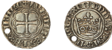
Figure 39 - Demi-gros denier blanc « à la couronne », fin janvier 1357, 1,64 g, 21,5 mm (BnF, MMA, Z2734).

D/ +IOHANNES : REX : FRAN̄C. Croix dans un octolobe.