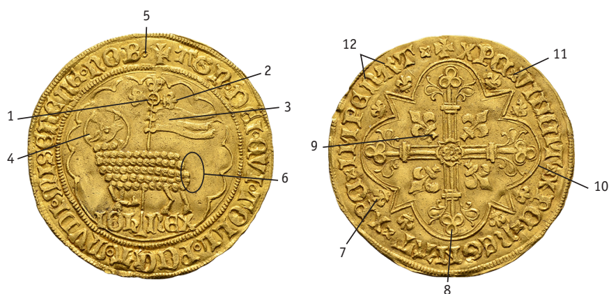
Figure 9 - Points analysés.