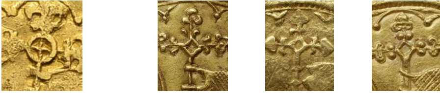
Figure 10 - Cerclage de la hampe du pseudo-double mouton (g.) et de trois moutons officiels (d.).