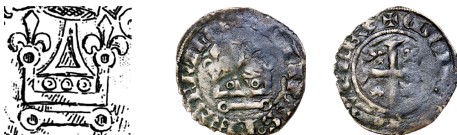
Figure 2 - Double denier tournois au châtel couronné, dont le fronton du châtel est en forme de triangle (écu) (CGB bry_447929).

Or, nous connaissons pour Jean II l'existence d'un double tournois figurant un triangle qui a justement cette fonction, dont certains exemplaires font apparaître un point de part et d'autre de ce triangle, ainsi qu'un recroisement de la croix latine du revers : le double tournois au châtel couronné dont les montants sont fleurdelisés (figure 2).