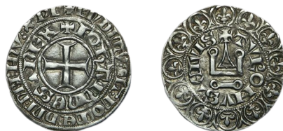
Figure 48 - Gros tournois « au châtel non meublé », juin 1359, 3,36 g, 24 mm (CLAIRAND 2005, p. 173, n° 492).

LAFURIE 1951, n° 363 ; DUPLESSY 1999, n° 351.