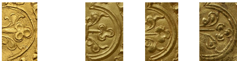
Figure 17 - Grand quadrilobe du pseudo-double mouton (g.) et de trois moutons officiels (d.).