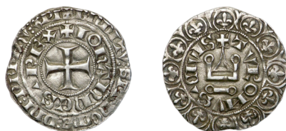
Figure 49 - Gros tournois «au châtel non meublé», juin 1359, 3,35 g, 23,5 mm, attribué ordinairement à Montpellier (CLAIRAND 2005, p. 173, n° 494 ; cf. BnF, MMA D193).

L'examen de dix exemplaires figurant dans le dépôt de Mirepoix a permis à A. Clairand de distinguer deux styles de gravure bien différents 120 . Le premier style, reconnu sur huit exemplaires, se caractérise dans la légende extérieure du droit par un lettrage large, par l'utilisation de \Pi onciaux et par l'absence de traits abrégiatefs (figure 49). Le deuxième style, particulier aux deux autres exemplaires, se reconnaît au contraire par un lettrage fin, par l'utilisation de N romains et la présence systématique de traits abrégiatefs (figure 50). En se fondant sur le grand écart de production entre les deux ateliers pour lesquels nous sommes certains d'une production de ces gros tournois, A. Clairand propose d'attribuer le premier style, plus courant, à l'atelier de Montpellier et le deuxième, plus rare, à celui de Toulouse. En outre, l'un des exemplaires du deuxième style, attribué à Toulouse, présente un différent discret sous la forme d'un besant posé sur chacun des douze lis du revers 121 .