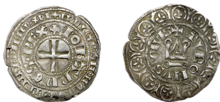
Figure 50 - Gros tournois «au châtel non meublé», juin 1359, 3,29 g, 25,5 mm, attribué par défaut à Toulouse (CLAIRAND 2005, p. 174, n° 500 ; cf. BnF, MMA G207).