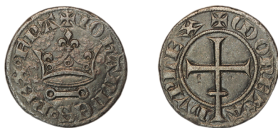
Figure 45 - Piéfort du double denier tournois « à la couronne sur barre annelée », 12 mai 1359, 7,53 g, 23 mm (BnF, MMA, Z2747) = DHÉNIN 1974.