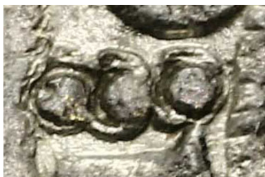
Figure 21 - Regravure sur un gros aux trois lis de trois points superposés sur trois annelets [pointés ?] superposés (CGB bry_280242).