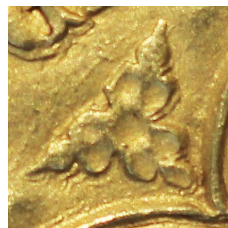
Figure 32 - Trèfle cantonnant le polylobe du revers (détail).

Bien que ne nous n'ayons aucune certitude d'une fabrication effective pour le royaume de France, cette espèce monétaire doit figurer dans la classification des espèces monétaires du règne de Jean II car elle a été ordonnée et ses conditions d'émissions ont été définies et envoyées aux ateliers du royaume.