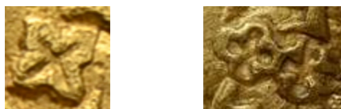
Figure 18 - Quadrilobe en ponctuation du pseudo-double mouton (g.) et d'un mouton officiels (d.).