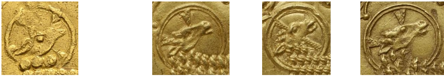
Figure 13 - Tête du mouton sur le pseudo-double mouton (g.) et sur trois moutons officiels (d.).