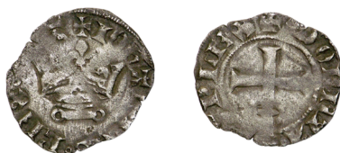
Figure 46 - Double denier tournois « à la couronne sur barre annelée », 12 mai 1359, 1,17 g, 22 mm (CLAIRAND 2005, p. 170, n° 476) = SAVÈS 1975, n° 1.

D/ +IOHANNES ◦ REX ◦ FR̄. Base annelée de châtel tournois sous une couronne portant trois annelets.