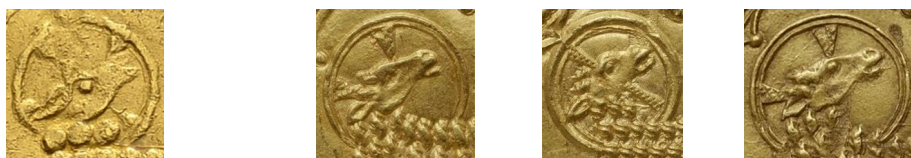
Figure 13 - Tête du mouton sur le pseudo-double mouton (g.) et sur trois moutons officiels (d.).