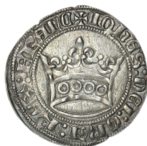
Figure 37 - Gros denier blanc « à la couronne », fin janvier 1357, 3,50 g, 27 mm (BnF, MMA, Côte750).

L'identification des gros et demi-gros à la couronne du Languedoc ne pose aujourd'hui pas de difficulté. Nous classons ici les rares gros et demi-gros d'argent figurant d'un côté une grande couronne garnie d'un bandeau d'annelets et de l'autre une croix pattée dans un polylobe 104 (figures 37-39). Rangées parmi les « gros de classement incertain » par J. Lafaurie (LAFaurie 1951, nos 318-319), ces espèces ont été attribuées au Languedoc par J. Duplessy (DUPLESSY 1999, nos 348-349). Les rares exemplaires conservés, notamment ceux issus du dépôt monétaire de Mirepoix, ont des masses qui s'accordent bien avec les indications figurant dans les registres de compte. Deux types de gravure se dégagent (figures 37-38), sans qu'il soit possible d'identifier les ateliers.