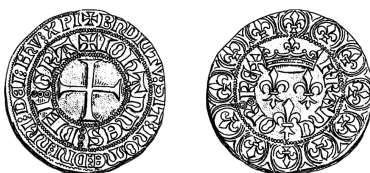
Figure 20 - Gros aux trois lis (HOFFMANN 1878, pl. XXI n° 37).

Les précisions apportées par les mandements et les exécutoires, en premier lieu l'appellation d'un gros denier blanc « à trois fleurs de lis » 59 , permet d'identifier avec certitude cette espèce comme étant le « gros aux trois lis » des numismates (figure 20).