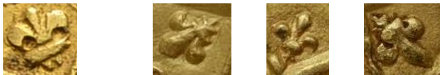
Figure 14 - Lis en cantonnement du pseudo-double mouton (g.) et de trois moutons officiels (d.).