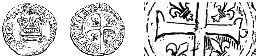
Figure 5 - Royaume de France, Jean II, double tournois au châtel couronné de la 2 e émission (HOFFMANN 1878, pl. XXIII, n° 64).