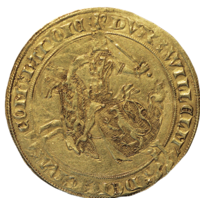
Figure 31 - Grand franc à cheval de Guillaume III, comte de Hainaut (BnF, MMA, 711).

francs à cheval de Jean II par au droit un lion en début de la légende et deux lions sur le caparaçon du cheval, et surtout au revers par des trèfles placés en cantonnement du polylobe dont les pointes sont tournées vers le centre (figure 32) 86 , ce qui pourrait constituer la « différence » évoquée dans le mandement du 14 avril 1361.