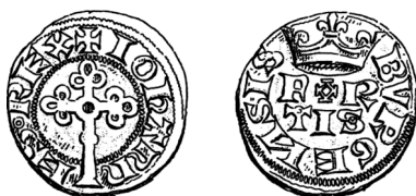
Figure 41 - Bourgeois fort, début 1357 (HOFFMANN 1878, pl. XXII, n° 53).

Sur le revers de l'exemplaire du bourgeois fort représenté dans Hoffmann, pl. XXII, n° 53 (figure 41), provenant de la collection Penchaud, le O de FORTIS est cruciforme au lieu d'être rond comme sur tous les exemplaires que nous avons jusqu'ici rencontrés et l'annelet est absent de la couronne. Ces deux éléments résultent probablement d'une mauvaise lecture d'un exemplaire mal frappé, le métal ayant été partiellement aspiré par le relief de l'avvers.