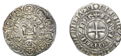
Figure 43 - Gros denier blanc « au châtel chargé d'un lis couronné », 12 mai 1359. Attribué ordinairement à Montpellier, 3,24 g, 23,5 mm (CLAIRAND 2005, p. 171, n° 485).

D'après le style des exemplaires de gros au lis couronné actuellement connus, que l'on attribue ordinairement à Montpellier, il est très probable qu'un autre des trois ateliers du Languedoc (Agen, Figeac, Loviguen) 111 a fabriqué cette espèce monétaire (figures 43-44). C'est le cas d'un exemplaire du trésor de Mirepoix, de style différent de ceux connus : le châtel y est un peu plus petit, on trouve une apostrophe après IOh et GR dans la légende du droit mais surtout les E onciaux portent une double barre dans la légende du droit 112 .