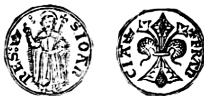
Figure 55 - Florin d'or. BnF, manuscrit français 5524 f° 89v°.

Le monnayage particulier du Languedoc prend fin avec l'ordonnance du 5 décembre 1360 qui rétablit la monnaie 24 e pour l'ensemble du royaume 131 .