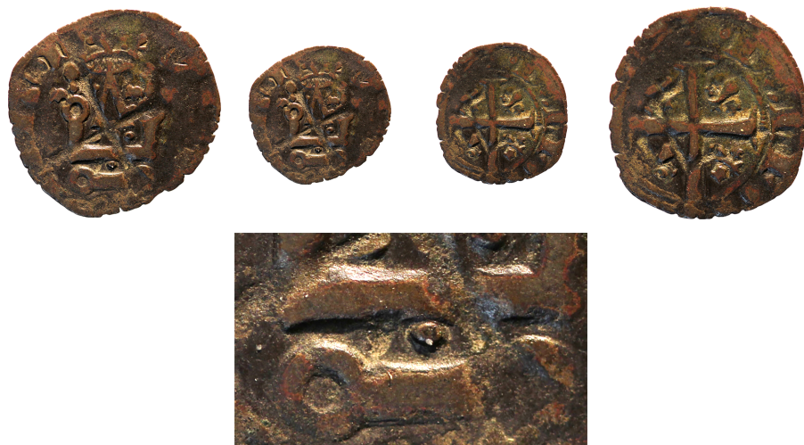
Figure 6 - Duché de Bretagne, Charles de Blois, imitation du double tournois de la 2 e émission 18 (BnF, MMA, 707) (agrandissement × 1,5).

Des interrogations existent également pour les marques de la 4 e émission, pour laquelle nous ne disposons d'aucun exemplaire royal. Nous sommes juste assurés par l'exécutoire du 24 mai 1354 que celles-ci ont bien été ordonnées (voir supra ) et que, logiquement, les exemplaires de cette émission reprennent les marques ordonnées de la 3 e , avec ajout d'un différent supplémentaire au droit et/ou au revers, qui nous est actuellement inconnu. Cependant des exemplaires bretons attribués à Charles de Blois autorisent une hypothèse les concernant (figure 7). Ces monnaies, bien que peu lisibles, présentent toutes deux au droit un anneau sous la barre d'assise du châtel et deux besants