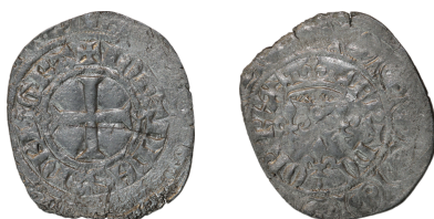
Figure 27 - Gros aux trois lis, 7 e émission, 1,83 g, 25 mm (BnF, MMA, N6968).