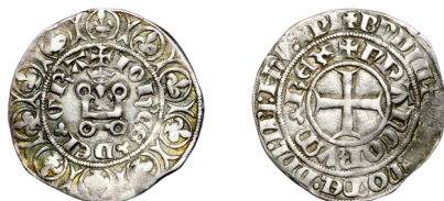
Figure 44 - Gros denier blanc «au châtel chargé d'un lis couronné», 12 mai 1359. Figeac ?, 3,17 g, 23,5mm (CLAIRAND 2005, p. 172, n° 491).

D/ +IOHES ♣ DEI ♣ GRÆ ; bordure extérieure de dix lis contenus dans des oves. Châtel tournois dont les meubles et le fronton sont remplacés par un lis couronné.