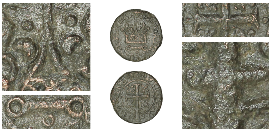
Figure 3 - Piéfort du double denier tournois au châtel couronné, 3 e émission (et détails des différents d'émission du droit et du revers) (BnF, MMA, C3635).