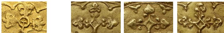
Figure 11 - Lis de la hampe du pseudo-double mouton (g.) et de trois moutons officiels (d.).