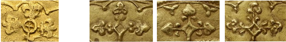
Figure 11 - Lis de la hampe du pseudo-double mouton (g.) et de trois moutons officiels (d.).