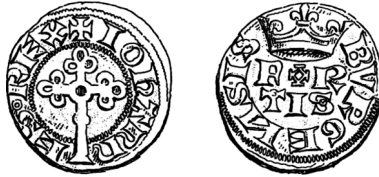
Figure 41 - Bourgeois fort, début 1357 (HOFFMANN 1878, pl. XXII, n° 53).

Sur le revers de l'exemplaire du bourgeois fort représenté dans Hoffmann, pl. XXII, n° 53 (figure 41), provenant de la collection Penchaud, le O de FORTIS est cruciforme au lieu d'être rond comme sur tous les exemplaires que nous avons jusqu'ici rencontrés et l'annelet est absent de la couronne. Ces deux éléments résultent probablement d'une mauvaise lecture d'un exemplaire mal frappé, le métal ayant été partiellement aspiré par le relief de l'avvers.