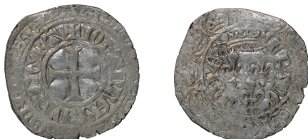
Figure 26 - Gros aux trois lis, 6 e émission (BnF, MMA, Z823).