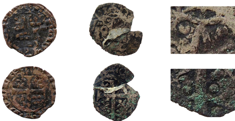
Figure 7 - Duché de Bretagne, Charles de Blois. Double denier tournois au châtel couronné, imitation de la 4 e émission royale. À g. Musée Dobrée, n° 5265-218 (agrandissement \times 3 ), au centre, fouilles du Guildo, n° 7001-6 (agrandissement \times 3 ). À droite, agrandissement du fronton accosté de deux besants et de la croix recroisetée , dont le pied est accosté de deux autres besants.

accostant le fronton du châtel ; au revers une croix recroisetée dont le pied est accosté, dans le champ, de deux besants 19 . Trois exemplaires présentant cette caractéristique avaient déjà été décrits – sans illustration – par Alexis Bigot puis Faustin Poey d'Avant 20 . Plus récemment, un second exemplaire, incomplet, a été identifié dans le mobilier numismatique des fouilles du château du Guildo (figure 7) 21 . La découverte ou la publication de nouveaux exemplaires bien lisibles devrait permettre de confirmer, d'amender ou de préciser nos propositions de différents d'émissions.