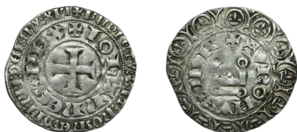
Figure 34 - Gros tournois «au châtel», fin octobre 1356, 2,65 g, 25,5 mm (CLAIRAND 2005, p. 171, n° 481).