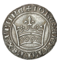
Figure 38 - Gros denier blanc « à la couronne », fin janvier 1357, 3,34 g, 25,5 mm (BnF, MMA, Côte751).