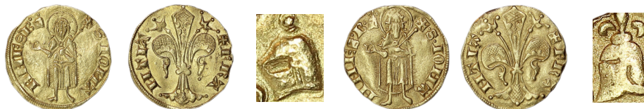
Figure 53 - Florin d'or, février 1360. Heaume pointé, 3,46 g, 20 mm (BnF, MMA Côte754).