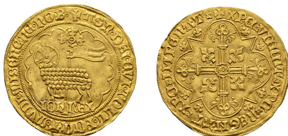
Figure 8 - Double mouton d'or de Jean II.

R/ +XPC × VINCIT × XPC × REGNAT × XPC × IMPERAT × (ponctuation par sautoir en relief). Croix aux bras fleuronés et feuillus, avec quadrilobe à quatre lobes et quatre pointes en cœur centré d'une rose, cantonnée de quatre fleurs de lis, dans un quadrilobe à quatre lobes et quatre pointes extérieures accostées chacune de deux fleurs de lis.