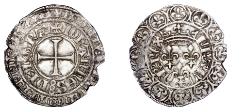
Figure 23 - Gros aux trois lis, 1 re , 2 e ou 3 e émission (CGB, VSO 39, n° 72).