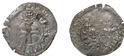
Figure 22 - Gros aux trois lis, hybride (BnF, MMA, Z824).

Un exemplaire de la trouvaille de Chilleurs 71 ainsi qu'un exemplaire passé récemment en vente 72 présentent une ponctuation par quadrilobes au droit comme au revers et un anneau dans le champ du revers, sous la couronne (figure 22). Cette ponctuation par quadrilobes et la présence de l'annelet sont considérés par A. Dieudonné comme des marques d'émission à part entière 73 . Nous estimons qu'il s'agit simplement d'hybrides résultants d'une frappe associant un coin de droit au différent quadrilobes ( légende ) et un coin de revers au différent annelet ( champ ) 74 .