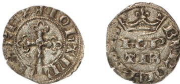
Figure 40 - Bourgeois fort, fin janvier 1357, 1,21 g, 22 mm (BnF, MMA, 1987.355).

Le bourgeois fort ordonné fin janvier 1357 est directement inspiré de celui créé par Philippe IV le 26 janvier 1311, dont il reprend exactement le type (figure 40) 105 . Cette monnaie n'a pas de correspondant dans celles qui furent frappées à cette époque par les ateliers du royaume. Selon Marc Bompaire cette pièce « marque peut-être une émission faite selon les avis ou grâce à des subsides des bourgeois ou des communautés 106 ».