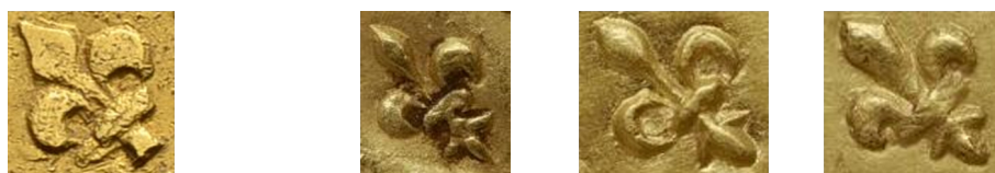
Figure 16 - Base des lis du pseudo-double mouton (g.) et de trois moutons officiels (d.).

La ponctuation de la légende par une sorte de sautoir en relief est originale, celle présente sur les moutons est systématiquement par double fleuron et les doubles moutons à la fleur de lis de fabrication brabançonne comportent tous une ponctuation également par double quadrilobe 32 (point 11 ; figure 18).