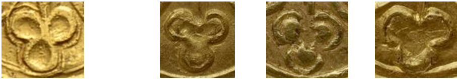
Figure 15 - Fleurons terminaux de la croix du pseudo-double mouton (g.) et de trois moutons officiels (d.).