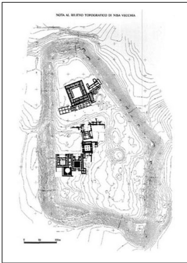
Figure 1 : Nisa

Nisa (en fait un site double, « Vieille Nisa » et « Nouvelle Nisa », distantes de 1,5 km) se trouve au Turkménistan, à une dizaine de kilomètres à l'ouest de la capitale Ashgabat. Elle fut la première capitale des Parthes « impériaux » depuis environ le milieu du II e s. av. n. è. (la capitale pré-impériale Asaak qui se trouvait un peu plus à l'ouest, peut-être dans la zone frontalière avec l'Iran actuel, n'a pas été identifiée). C'est l'époque où les souverains arsacides se proclament « philhellènes », orientation que l'architecture et l'art de Nisa expriment amplement.