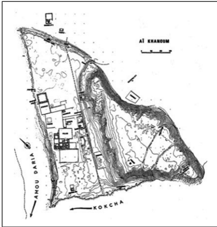
Figure 2 : Aï Khanoum

La ville d'Aï Khanoum, à la frontière de l'Afghanistan et du Tadjikistan, est mieux connue du public occidental ; la documentation en est en tout cas plus accessible 14 . Elle a été fouillée de 1964 à 1978 par la DAFA (Délégation archéologique française en Afghanistan) sous la direction de Paul Bernard. Après l'interruption de la fouille par les événements d'Afghanistan, le site a été soumis à un pillage complet. Certains objets qui en étaient très probablement issus sont apparus sur le marché des antiquités et ont été publiés. À supposer que la fouille puisse reprendre un jour, elle ne pourrait concerner que de petits secteurs.