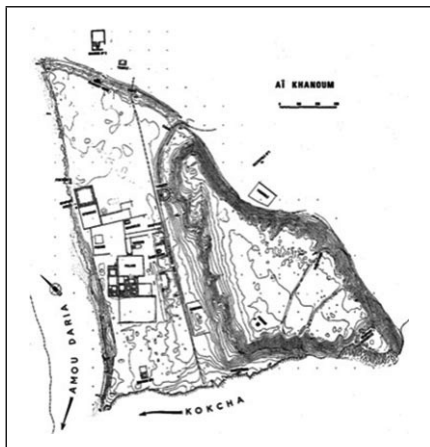
Figure 2 : Aï Khanoum

La ville d'Aï Khanoum, à la frontière de l'Afghanistan et du Tadjikistan, est mieux connue du public occidental ; la documentation en est en tout cas plus accessible 14 . Elle a été fouillée de 1964 à 1978 par la DAFA (Délégation archéologique française en Afghanistan) sous la direction de Paul Bernard. Après l'interruption de la fouille par les événements d'Afghanistan, le site a été soumis à un pillage complet. Certains objets qui en étaient très probablement issus sont apparus sur le marché des antiquités et ont été publiés. À supposer que la fouille puisse reprendre un jour, elle ne pourrait concerner que de petits secteurs.