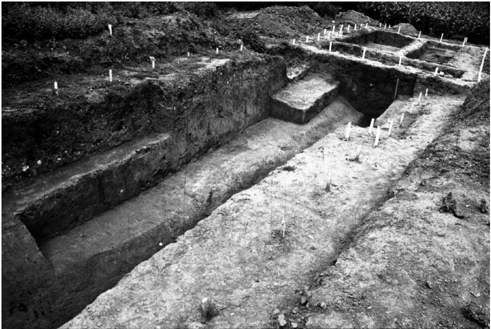
Fig. 5. Vue en cours de fouilles du côté oriental du fossé du sanctuaire.

Cette année-là, près de huit cents artefacts en fer sont sortis de terre, comprenant : des épées, leurs fourreaux et leurs systèmes de suspension, des éléments de bouclier, des armes d'hast, des fibules et quelques rares outils. Certains portent les impressionnants stigmates de mutilations volontaires. La présence exceptionnelle d'un bracelet en alliage cuivreux dans le côté sud de l'entrée fait office de marqueur chronologique, puisque son style plastique