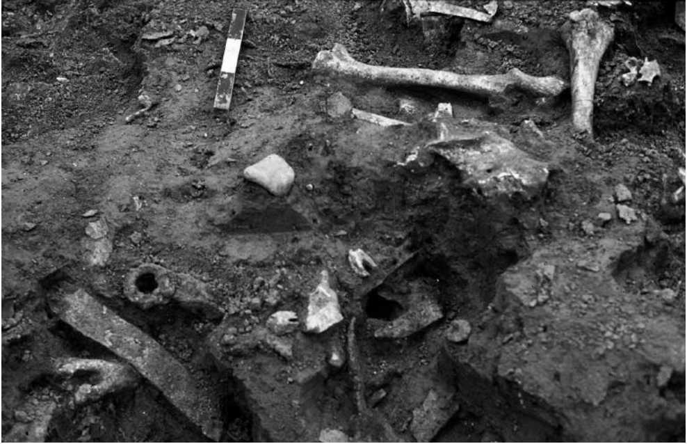
Fig. 3. Vue en cours de fouilles du fossé présentant une imbrication complexe d'ossements et d'artefacts en métal.