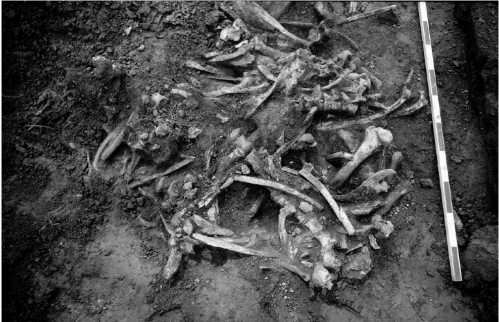
Fig. 6. Superposition d'ossements d'animaux dans les dépôts de l'entrée orientale du sanctuaire.

Colloque International sur l'art celtique du Collège de France, sous la direction de P.-M. Duval et V. Kruta (fig. 7) 21 . Ce sont quelques-uns des plus éminents spécialistes de la Protohistoire, représentants de grandes institutions européennes, qui sont accueillis sur place. Forts de leur savoir et de leur expérience de terrain, ils ont pu conseiller et aiguiller avec précision les fouilleurs et les restaurateurs. Cette rencontre initie un mouvement de reconnaissance dans le milieu académique, rapidement consacré par les premières publications, dont une communication lors d'un colloque tenu à Tours en 1978 22 .