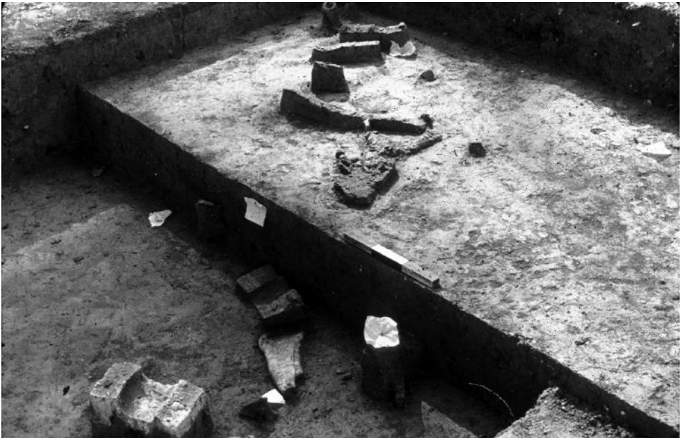
Fig. 4. Fouille du fossé par passes horizontales de 10 centimètres de profond.