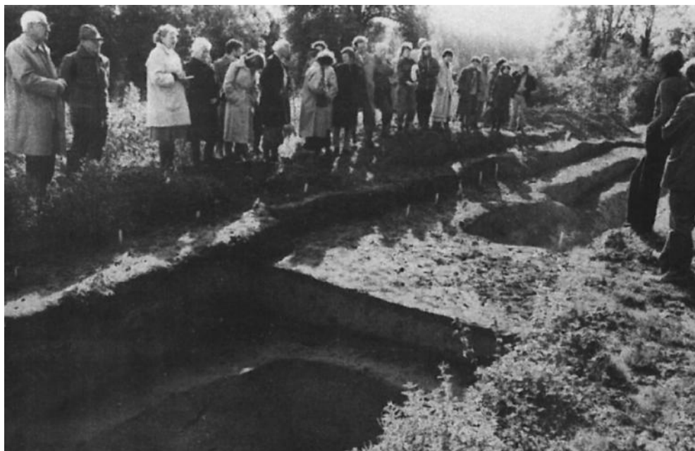
Fig. 7. Excursion des participants du Colloque International d'Archéologie Celtique du Collège de France, le 30 septembre 1978.

construites en matériaux pérennes, dont le fanum . Ainsi, J.-L. Brunaux décide-t-il d'ouvrir le chantier à cet endroit, en postulant la perpétuation des lieux sacrés à travers les époques 23 .