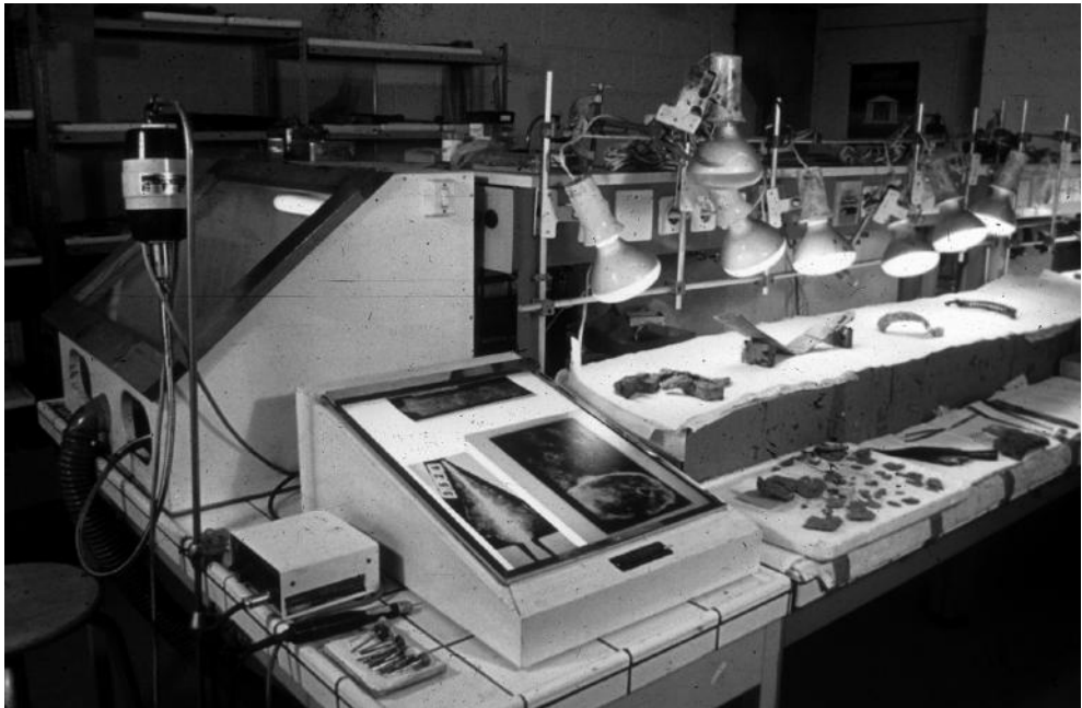
Fig. 8 : Premiers postes de restauration de l'Université Technologique de Compiègne.

Les décors apparaissent aussi, plus nombreux et complexes que ce que l'on imaginait, et amènent à réfléchir sur l'importance des armes ornées.