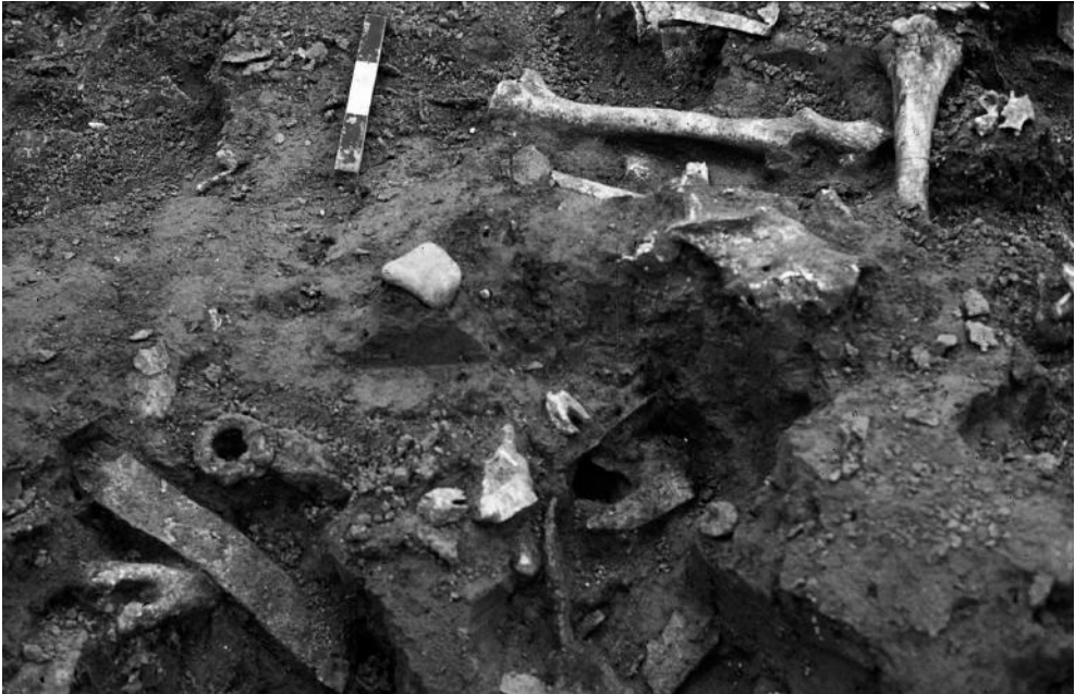
Fig. 3. Vue en cours de fouilles du fossé présentant une imbrication complexe d'ossements et d'artefacts en métal.