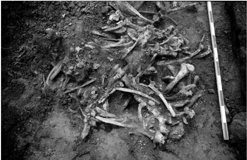
Fig. 6. Superposition d'ossements d'animaux dans les dépôts de l'entrée orientale du sanctuaire.

Colloque International sur l'art celtique du Collège de France, sous la direction de P.-M. Duval et V. Kruta (fig. 7) 21 . Ce sont quelques-uns des plus éminents spécialistes de la Protohistoire, représentants de grandes institutions européennes, qui sont accueillis sur place. Forts de leur savoir et de leur expérience de terrain, ils ont pu conseiller et aiguiller avec précision les fouilleurs et les restaurateurs. Cette rencontre initie un mouvement de reconnaissance dans le milieu académique, rapidement consacré par les premières publications, dont une communication lors d'un colloque tenu à Tours en 1978 22 .