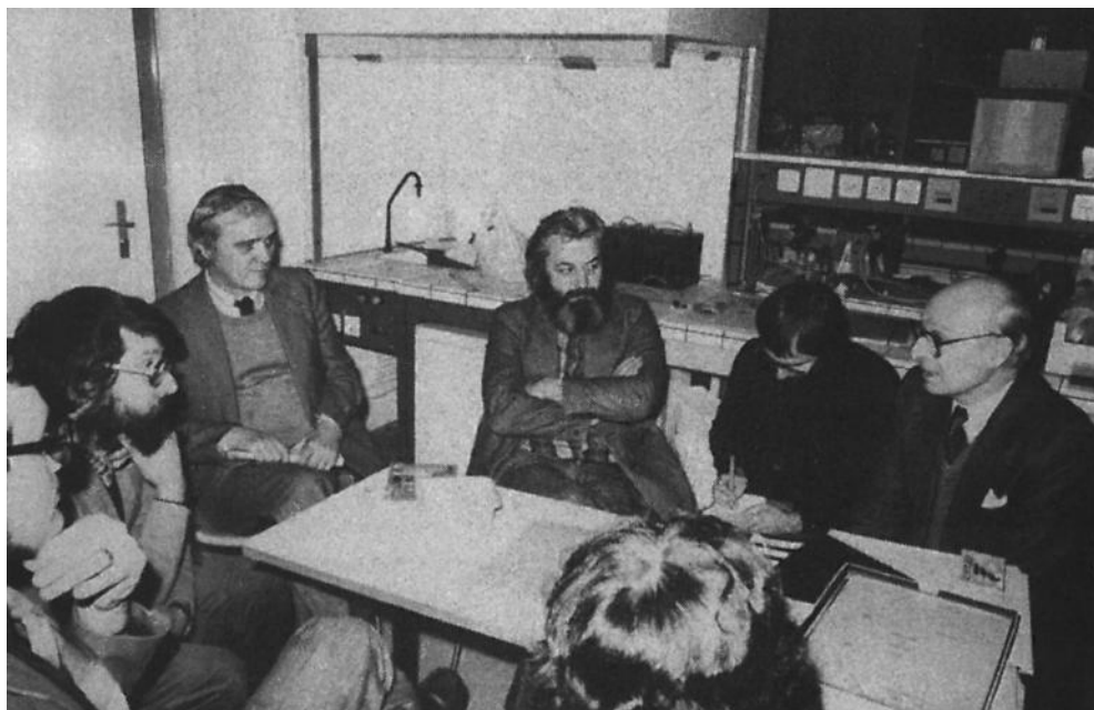
Fig. 9. Visite d'A. France-Lanord du Musée du Fer de Nancy à l'UTC, le 21 novembre 1977.

métaux anciens ». À cette occasion, se monte une exposition impromptue d'un certain nombre d'objets de Gournay-sur-Aronde (fig. 9). En l'espace de quelques mois, l'IRRAP met au point un protocole de documentation, de nettoyage, de stabilisation et de remontage des objets avec le concours de personnalités et d'établissements importants. La conception de ce programme de restauration et de conservation a par la suite attiré de nombreuses commandes, qui ont contribué au rayonnement national de ce laboratoire 35 .