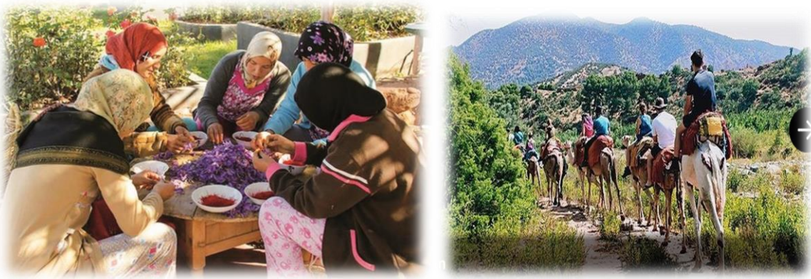
Figure 3 : coopérative de valorisation de safran à l'Ourika