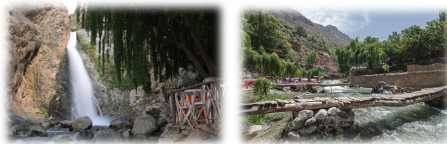
Figure 1 : Photos de la vallée de l'Ouirika

La vallée de l'Ouirika est une vallée située à la commune d'Ourika 1 . Cette vallée est connue pour ses paysages spectaculaires et sa biodiversité. Elle est également un lieu de villégiature très apprécié des touristes.