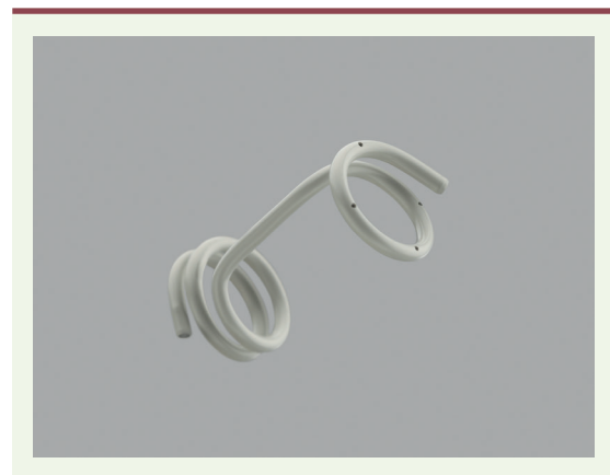
Figure 2. Drain vésico-amniotique, commercialisé par Cook® Medical (J-HFBS-503540, Harrison Fetal Bladder Stent Set, Cook® Medical, Bloomington, États-Unis).

Le fœtoscope permet d'explorer la vessie du fœtus jusqu'au col vésical et à l'urètre postérieur pour visualiser l'obstacle. La valve de l'urètre postérieur, la sténose urétrale et l'urétérocèle obstructive peuvent faire l'objet d'un traitement endoscopique. L'arsenal thérapeutique comprend des fibres laser permettant de sectionner la valve,