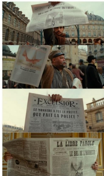
Figure 4 : Des crieurs de journaux au Président lisant un article sur l'affaire du ptérodactyle (montage, 26'44'' à 27'16'')

Dans son œuvre dessinée, Tardi accorde une large place à la culture médiatique contemporaine d'Adèle et notamment à la presse. Les journaux sont un puissant embrayeur narratif et c'est par ce biais que les lecteurs, tout comme Adèle, suivent la progression de l'intrigue ou l'incursion d'un événement perturbateur. À cet égard, Tardi inclut souvent, en pleine case, de nombreux entrefilets de journaux, destinés à relater certains épisodes non dessinés, comme les attaques répétées du ptérodactyle (1976a, p. 8-9). Si leur utilisation participe évidemment de l'effet de réel, elle permet aussi de faire participer le lecteur à l'enchevêtrement narratif et au mystère qui s'épaissit, en lui donnant à lire le récit partiel des faits chroniqués par les journalistes. Besson donne lui aussi à voir plusieurs titres de presse, comme Excelsior ou Le Petit Parisien , vendus par des crieurs (figure 4). Il utilise la lecture silencieuse des titres par certains personnages comme moyen de précipiter l'action : là, Caponi lit Le Petit Parisien avant de se voir confier l'affaire du ptérodactyle ; ici, Adèle découvre dans L'Intransigeant qu'Espérandieu est condamné à mort.