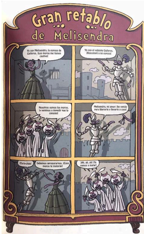
Imagen 1: El retablo de Maese Pedro, anverso (Rob DAVIS, Don Quijote , trad. José C. Vales, Madrid, Kraken, 2014, p. 205).