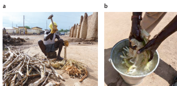
▲ Figure 3. (a) Au Ghana, des branches sont écrasées puis trempées dans l'eau, formant ainsi un gel. (b) Cette eau gluante est utilisée avec de la bouse de vache diluée comme eau de gâchage d'un enduit.

culiers forment instantanément un gel capable de coller les argiles (figure 3a et b) [3].