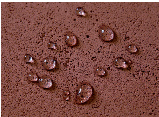
▲ Figure 6. Gouttes d'eau sur un enduit de terre rouge au blanc d'œuf.

Ce sont des molécules particulières, dites amphiphiles : elles présentent une partie hydrophile et une partie hydrophobe. La caséine du lait, l'albumine du blanc d'œuf et du sang ainsi que le collagène contenu dans les colles de peau ou d'os sont les principales protéines recensées dans ce cahier de recettes traditionnelles. La caséine joue un véritable rôle de colle des argiles. La molécule d'albumine, qui représente environ 5 % du blanc d'œuf, est directement disponible pour interagir avec les argiles, sans préparation initiale [4]. C'est une colle très puissante des argiles qui rend la terre hydrophobe. En effet, les parties hydrophiles de cette molécule s'adsorbent sur les plaquettes d'argile tandis que les parties hydrophobes restent à l'extérieur de la matière et donc au contact de l'air, formant une sorte de pellicule de surface qui repousse l'eau. On peut voir que sur un enduit de terre rouge où l'eau de gâchage a été remplacée par du blanc d'œuf, des gouttes d'eau forment de petites perles et ne sont pas absorbées par la terre (figure 6).