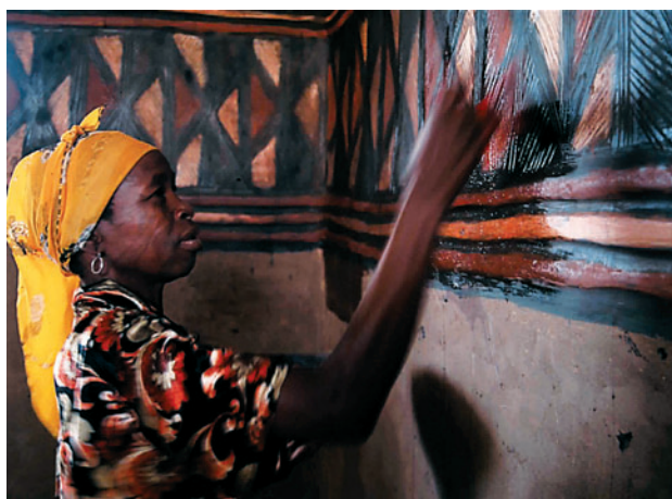
▲ Figure 8. Application d'un badigeon de cosses de néré.

est préparée en faisant bouillir ces gousses, ce qui libère les tanins qu'elles contiennent. Appliqué en badigeon sur les peintures colorées qui ornent les maisons, ce liquide brun rend la surface brillante et plus dure (figure 8). Ces peintures, ainsi protégées, résistent mieux à l'eau de pluie.