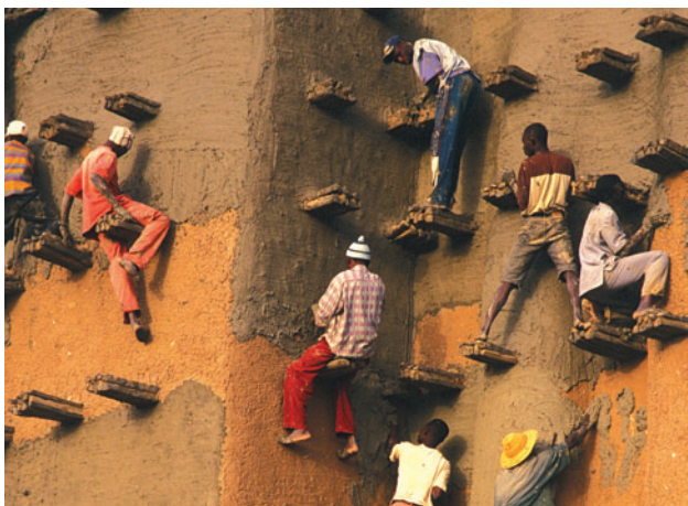
▲ Figure 1. Les maçons de Djenné (Mali) enduisent la mosquée, hissés sur les échafaudages permanents en bois.

La terre crue, matériau local par excellence, a prouvé sa durabilité dans le temps, comme le montre une partie de la muraille de Chine construite en terre il y a plusieurs siècles. Pourtant, elle est particulièrement vulnérable aux phénomènes d'érosion. Traditionnellement, un entretien régulier des constructions était suffisant. Aujourd'hui, la plupart des sites sont davantage exposés aux intempéries, notamment à cause des changements climatiques qui créent de nouvelles conditions naturelles pour lesquelles ces architectures n'étaient pas forcément conçues. La préservation de ces sites se traduit généralement par le recouvrement d'enduits en terre. C'est le cas, par exemple, de la mosquée de Djenné au Mali (figure 1) où toute la population prend part à cet entretien lors de festivités annuelles.