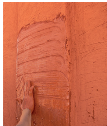
► Figure 5. Application d'un enduit à partir de terre rouge et de beurre de karité fondu à Ségou (Mali).