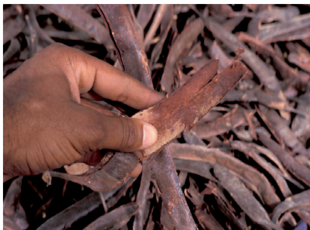
▲ Figure 7. Cosses de néré.

Cette catégorie regroupe les tanins et les résines, molécules complexes inclassables parmi les trois premières catégories. Les tanins, molécules très répandues dans le règne végétal, que l'on trouve en quantité importante par exemple dans l'écorce du chêne ou de l'acacia, dans les feuilles de thé ou la peau des raisins, sont utilisés comme stabilisants. Ils ont la particularité de disperser les plaquettes d'argile. La recette la plus répandue est pratiquée dans le nord du Ghana et au Burkina Faso [5]. Une décoction de cosses de néré (figure 7)