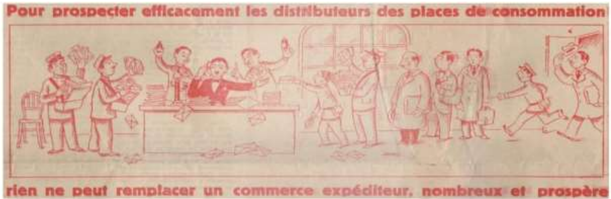
Fig. 4 : Prix-courant, Maison Delon, années 1900