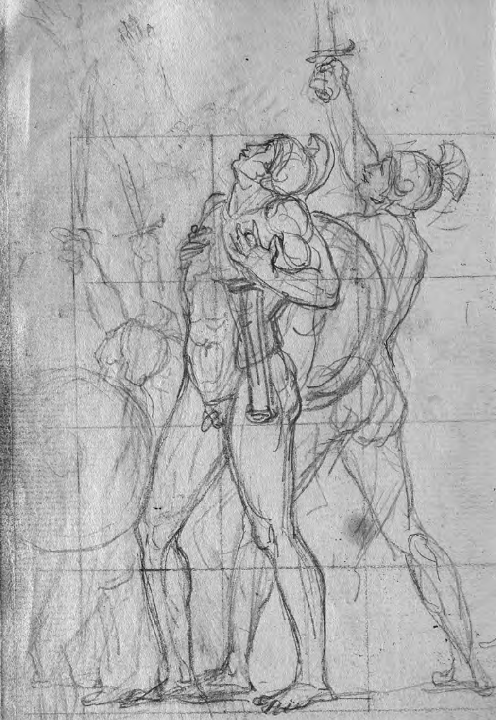
David, Carnet de croquis pour Le Serment du Jeu de Paume : groupe de soldats nus et casqués tournés vers la gauche, mise au carreau à la sanguine, 0,192 m x 0,125 m, Versailles, châteaux de Versailles et de Trianon.