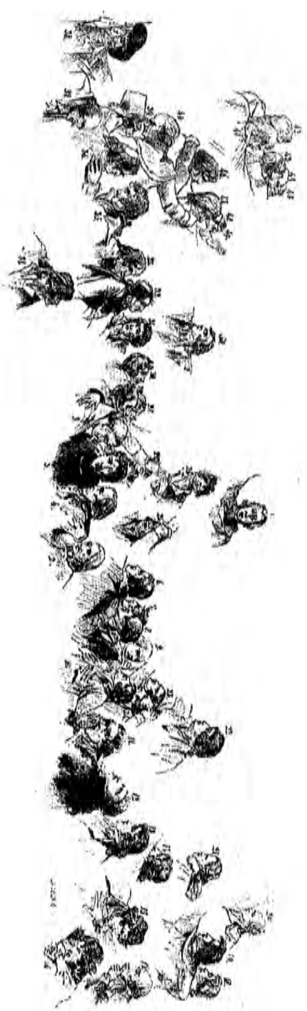
INDICATEUR DE SARRINT DE JEU DE PAUME