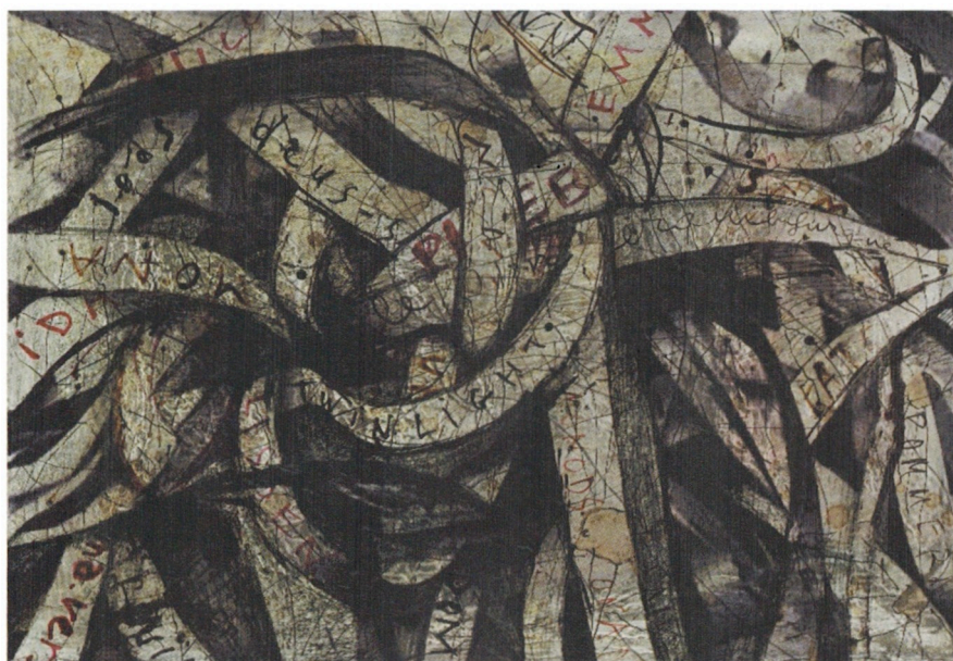
La Faute à Rousseau n° 66- Juin 2014

Béatrice Turquand d'Auzqy : « Les Bandes »