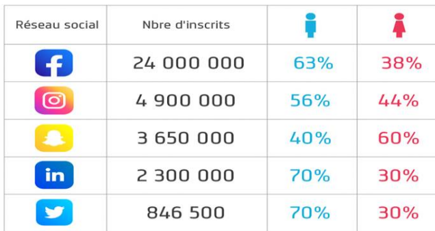
Figure 2. Chiffres clé de Facebook en Algérie

Ces travaux ont justement pu dépasser la vision non dualiste et logocentrique (Paveau, 2013) des discours numériques. Ainsi, l'intention est plus focalisée sur les phénomènes qui caractérisent l'espace technodiscursif algérien sur les médias sociaux Facebook, Twitter et autres, suivant une perspective intégrative des éléments langagiers et non langagiers des observables discursifs. L'article de Benaldi Hassiba (2021) explore les manifestations du pathos dans les stratégies technodiscursives des facebookers pendant la pandémie de la Covid-19. Elle analyse comment la dimension pathémique se construit et se manifeste dans les technodiscours des internautes algériens pour sensibiliser contre la Covid-19. Les hashtags comme nouvelles modalités de discours rapporté sont l'objet de l'article de Medane (2020). Elle propose une analyse discursive du hashtag #Non_aux_africains_en_Algérie #للأفارقة في الجزائر comme catalyseur d'une campagne de mépris et de haine envers les réfugiées subsahariens en Algérie. Elle propose d'analyser suivant les cadres théoriques de l'AD et de l'ADN "les différentes manifestations de l'acte de mépris, notamment les marques énonciatives et les aspects pragmatiques". Son article vise en fin de compte à saisir les mécanismes de négociation de l'acte de mépris dans une interaction via les hashtags. De même, Benyoub, M. (2019) dans son mémoire de master, amorce quelques "Réflexions Autour Des Nouvelles Fonctions Discursives Du Hashtag sur