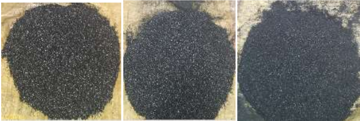
Figure 1 : Photographies des 3 biochars broyés et tamisés à une granulométrie comprise entre 0,25 et 2,00 mm De gauche à droite : biochars de noix de coco, de coques de noix de palmiste et de rafles