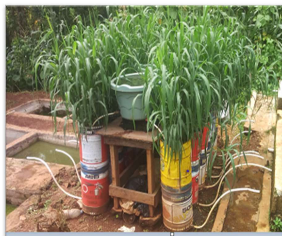
Figure 3 : Photos des dispositifs expérimentaux : Filtre à biochar en haut, filtre à sable en bas

L'espèce Echinochloa pyramidalis (communément appelée roseau) a été choisie pour les essais compte tenu de son efficacité épuratoire reportée dans les travaux précédents (Fonkou et al., 2010), et de sa disponibilité dans la zone d'étude. De jeunes pousses d'une hauteur moyenne de 21 \pm 5 cm et possédant entre 2 et 5 feuilles avec un système racinaire long de 5 \pm 3 cm, ont été prélevées à l'aide d'une machette, caractérisées et repiquées dans les filtres le même jour à raison de 6 plants par filtre soit une densité de 85 plants au m^2 .