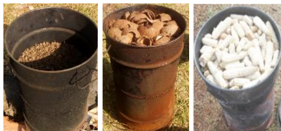
86 Figure 1. Différents résidus utilisés pour la production du biochar

87 Ces résidus agricoles ont été choisis en raison de leur disponibilité locale en grande quantité. Il est à noter que les 88 coques de noix de palmiste posent un problème sanitaire dans les zones de grande production et une valorisation 89 permettra de résoudre ce problème. Après production du biochar, il a été écrasé et tamisé pour obtenir les 90 granulométries comprises entre 0,25 - 1 mm et entre 1 – 2 mm. Cette granulométrie a été choisie suivant les 91 granulométries de la couche filtrante du second étage des filtres plantés à écoulement vertical proposée par Molle 92 et al. , (2005). La granulométrie comprise entre 0,25 mm et 1 mm a été utilisée pour le sable. Pour ce qui est du 93 gravier, deux granulométries ont été utilisées à savoir : celle comprise entre 2 mm et 12 mm et celle comprise entre 94 10 et 20 mm. Morand (2007). Echinochloa pyramidalis (communément appelé Roseau) a été choisie pour les essais 95 d'épuration compte tenu de son efficacité épuratoire reportée dans les travaux précédents notamment ceux 96 effectués par Fonkou et al. , (2010) ; et de sa disponibilité dans la zone d'étude. Des jeunes pousses d'une hauteur 97 moyenne de 21 \pm 5 cm et possédant entre 2 et 5 feuilles avec un système racinaire long de 5 \pm 3 cm ; ont été 98 prélevés à l'aide d'une machette, caractérisés et repiqués dans les filtres le même jour. La figure 2 illustre la mesure 99 de la hauteur des jeunes pousses.