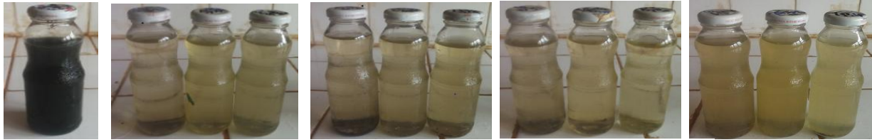
155 a) Eau Brute b) Effluents des filtres à 156 biochar à base des rafles 157 de maïs c) Effluents des filtres à 158 biochar à base des coques d) Effluents des filtres à biochar à base des Coques e) Effluents des filtres à sable (Témoin)

153 Le figure 5 présente l'eau brute et les effluents issues des filtres. A l'observation nous constatons que par rapport à 154 l'eau brute, les effluents des filtres sont plus clairs.