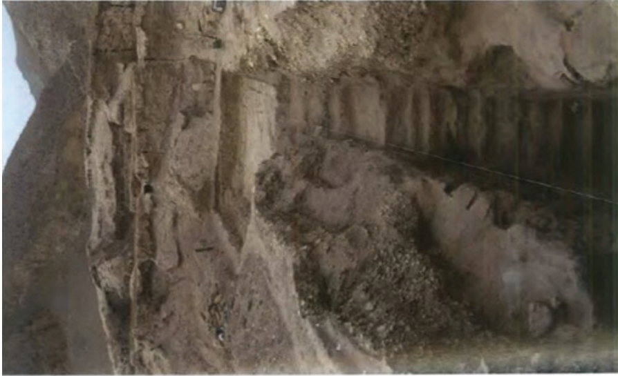
FIG. 5. — Takht-i Sangin, escalier creusé dans la terre (id., p. 173 fig. 3).