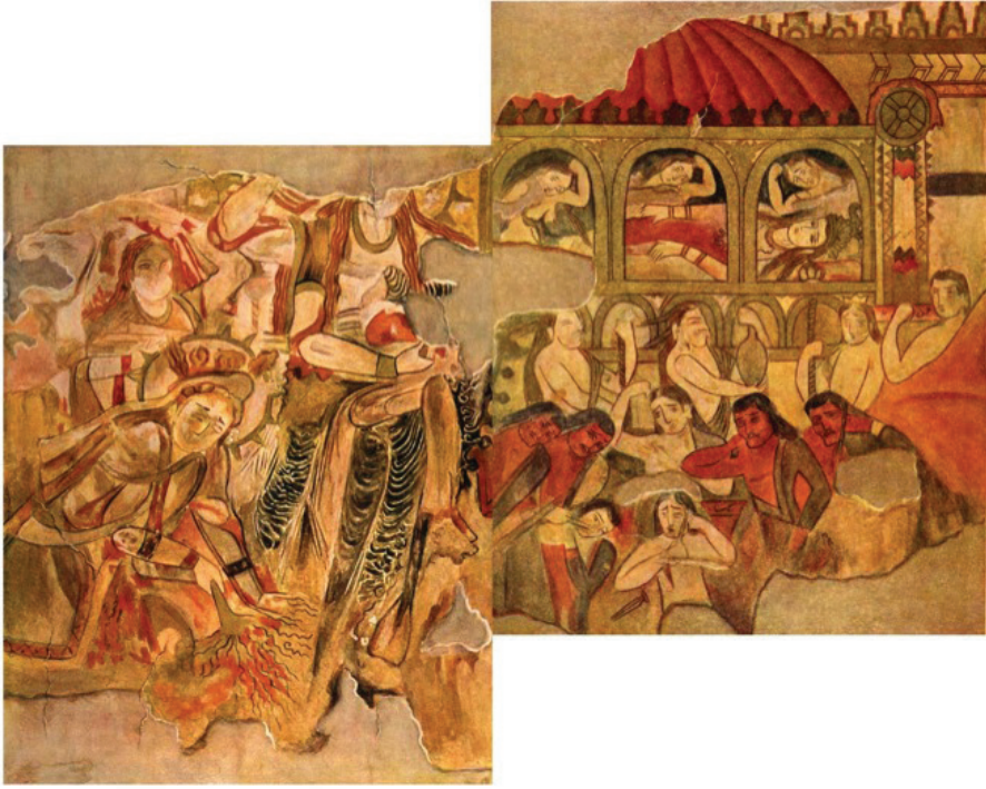
FIG. 3. – Peinture du Temple II de Pendjikent, VI e siècle (copie) (A. Ju. Jakubovskij et M.M. D'jakonov, Zhivopis' drevnego Pjandzhikenta , Moscou, Izd. A.N. SSSR, 1954, pl. XX-XXIII).

temple de Pendjikent (fig.3) 23 . Le dieu auquel les Sogdiens adressaient encore leurs lamentations à la veille de la conquête arabe était Tammuz, le jeune dieu babylonien de la nature mourante et renaissante, amant de la déesse Nana, la mésopotamienne Ishtar, qu'on reconnaît sur cette peinture, revêtu des « habits noirs formant des plis » dont parle le texte. L'un et l'autre avaient été introduits en Asie centrale à l'époque achéménide, et le culte de Tammuz si précisément décrit par l'envoyé chinois ressemble trait pour trait à celui que pratiquaient encore à l'époque abbasside les Sabéens de haute Mésopotamie 24 .