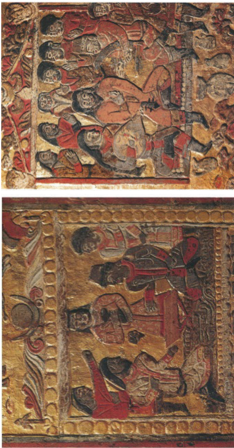
FIG. 1. — Lit funéraire du sabao An Qia, mort en 579 (détail). Musée de Xi'an. ( Anjia tomb of Northern Zhou at Xi'an , Beijing [Wenwu Chubanshe], 2003).