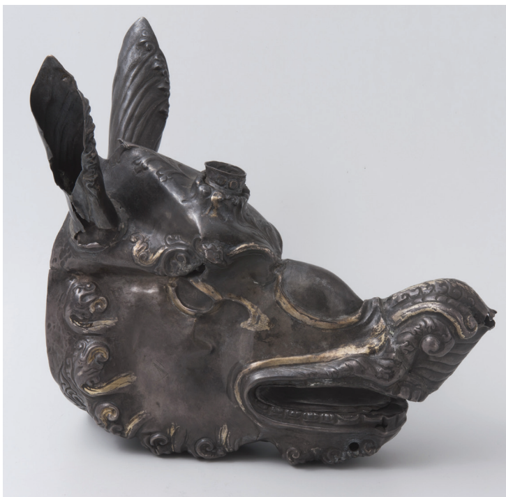
FIG. 2. – Ornement en argent doré. Sogdiane, 1 re moitié du VIII e siècle. Musée de l'Ermitage.