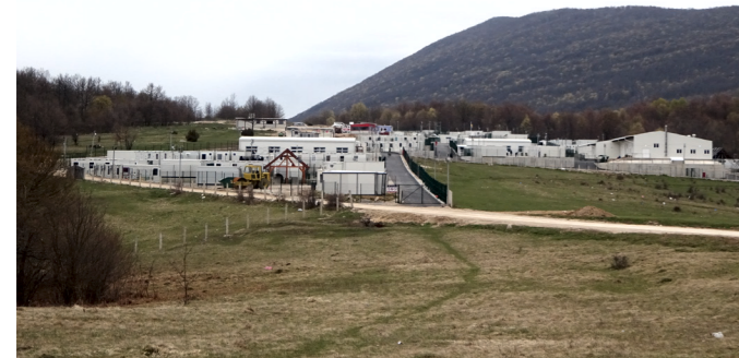
Le Temporary Reception Center de Lipa, sorti de terre en pleine montagne à 23 kilomètres de Bihać.

Le laboratoire Migrations internationales, espaces et sociétés (Migrinter, UMR 7301 – CNRS/Univeristé de Poitiers) analyse l'environnement des camps de personnes migrantes en Europe, en prenant en considération leur lieu d'implantation, leur potentiel isolement et les manières dont les personnes encampées peuvent s'approprier ces lieux.