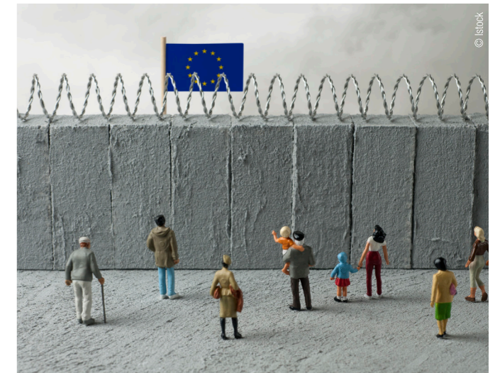
Entre 2018 et 2022, environ 87 000 personnes ont tenté de rejoindre l'Union Européenne depuis la Bosnie-Herzégovine.

À Bihać, les personnes migrantes indésirables sont ainsi reléguées dans les espaces discrets, lugubres et peu fréquentés de la ville. L'aide qui leur est apportée dans ces conditions est certes précieuse mais déshumanisante. Au cours de cette période d'observation, Migrinter a pu comprendre comment s'organise l'aide informelle dans la ville de Bihać et analyser les stratégies spatiales mises en place (Où sont les meilleurs endroits pour rencontrer les personnes ? Où sont situés les campements informels ? Où sont les commerces favorables aux PoM ? Où aller faire ses courses ?). Cette observation s'est ensuite étoffée d'entretiens formels avec des responsables politiques et des visites de lieux d'encampement. Cette étude a mis en évidence que les personnes migrantes sont effectivement victimes d'injustices dans