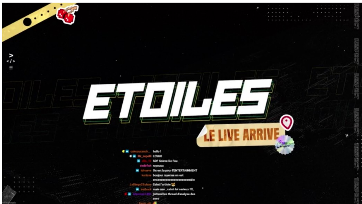
Figure 1 — Écran d'attente du streameur Étoiles