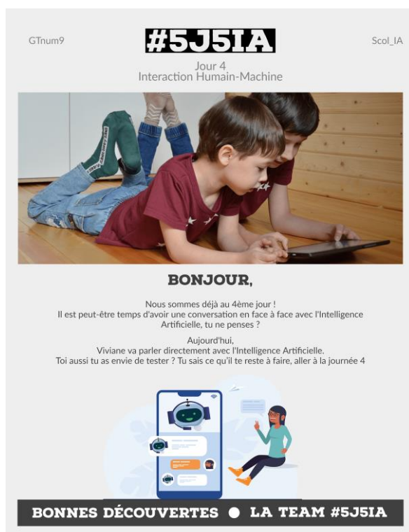
Figure 18. Le livret pédagogique 5J5IA

Le dispositif 5J5IA (pour 5 jours, 5 IA) 36 est un livret pédagogique prêt à l'emploi, incluant une enquête scientifique. Ce dispositif pédagogique vise une régulation de l'IA par la pédagogie de la découverte, par l'apprentissage et l'appropriation. La philosophie de 5J5IA repose tout d'abord sur ce qui a permis de réunir les chercheurs et auteurs de cet article. Tous questionnent l'usage des technologies en éducation pour les rendre sociales, en se basant sur l'activité réelle, l'expérience authentique vécue et sur une amplification du dispositif pédagogique par usage efficient du numérique en éducation. Nous avons donc élaboré un projet basé sur des activités concrètes et réalistes de l'IA. Par ailleurs, le livret pédagogique explicite l'articulation voulue, entre notre cadre théorique ci-dessus, la recherche et le projet pédagogique support, dont nous allons évoquer, ci-dessous, les grands principes.