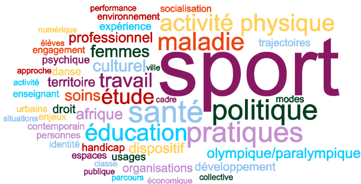
Figure 2. Nuage de mots représentant les thématiques de recherche et les intitulés de Doctorat des jeunes chercheur·ses.

sous des angles transversaux variés : politiques publiques, enseignement, genre, socialisation, territoires, numérique, ou encore profession.