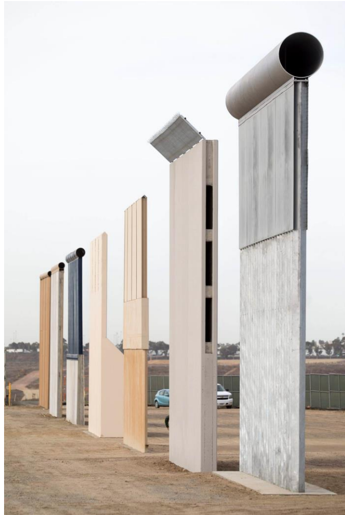
Fig. 2 – I prototipi di muro