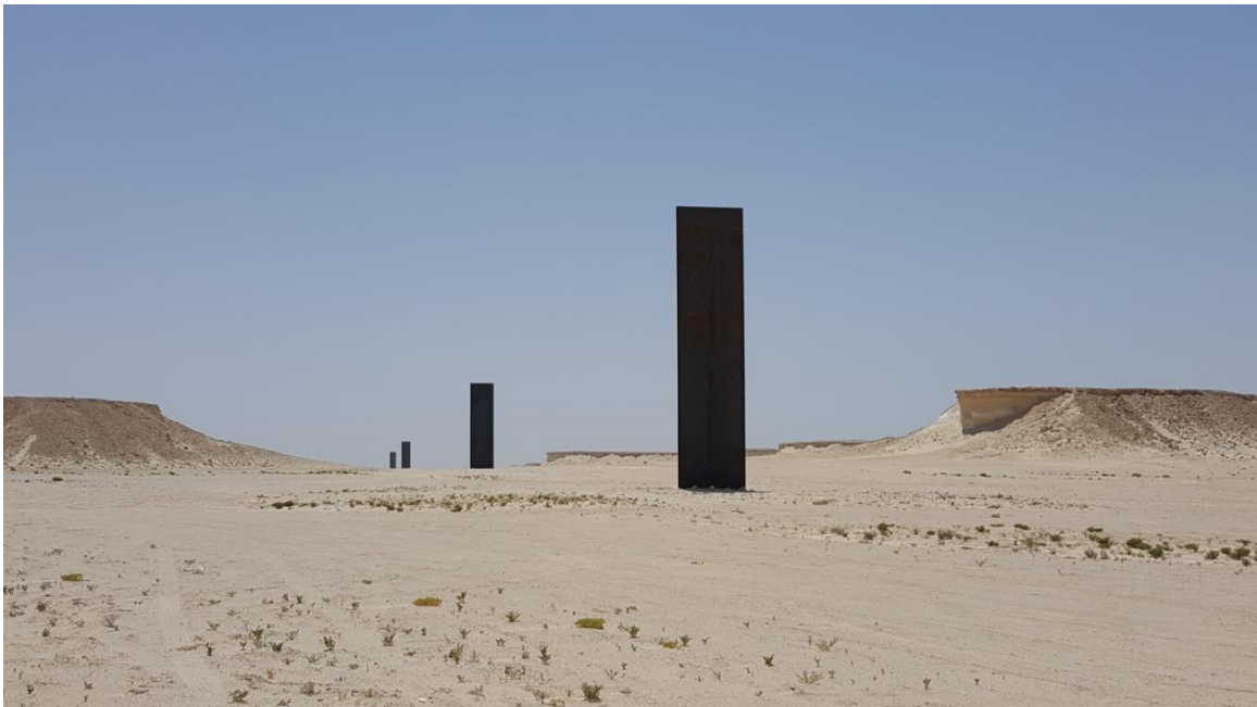
Fig. 3 – Richard Serra, East-West/West-East, 2014, Deserto del Qatar